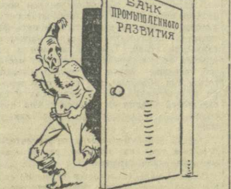
Бедняга понял сразу вдруг: «Начисто малого обмыли!» «В глазах как будто зарыбило. И словно радуги — воокруг.»

«В Мюнхене в бывшем «коричневом доме» был замечен появившийся там дух Геринга... Он был облачен в фашистский мундир и при всех регалиях.» (Журнал «Кавальтейд»).