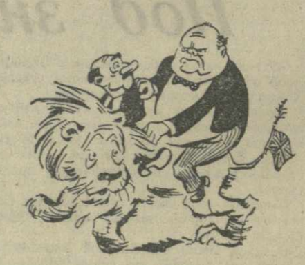
«Иной живи и здравствуй! Другой — напротив сгини!» Всей лейбористской паствой Черчилль вертит один!

«Черчилль изменил, что оппозиция полностью поддерживает внешнюю политику лейбористского правительства...» (Рейтер).