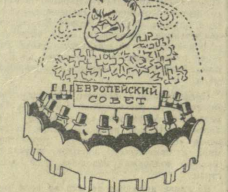
«Не дивитесь, друзья. Что как раз Между вас, На тире веселом я Провалился!»