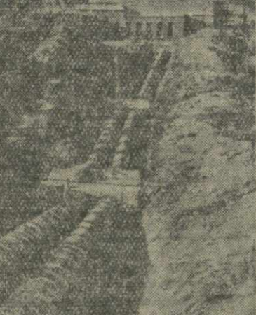
Тирнопонская гидроэлектростанция даст электроэнергию в хозам Горьковского и других районов. С пуском Тирнопонской электростанции будет завершена сплошная электрификация сельского хозяйства Горьковского и прилегающих к нему районов.