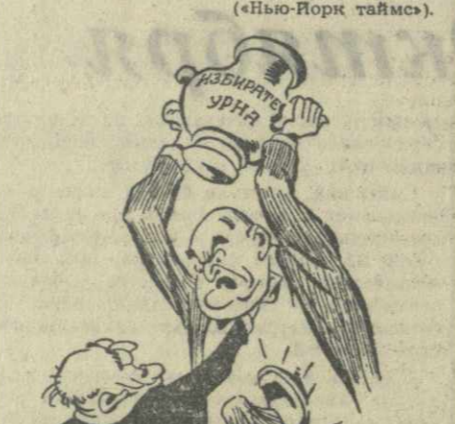
«Непопад и ты проворен. Не смотри, что я старик... Подвинься, как раскроен «Демократии» их лик...»