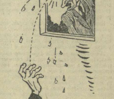
«Я оглушен! Я понял, други, И фш, и дис, и всякой прех... Умолют звуки этой фуги, И маршем прогнет их крах.»