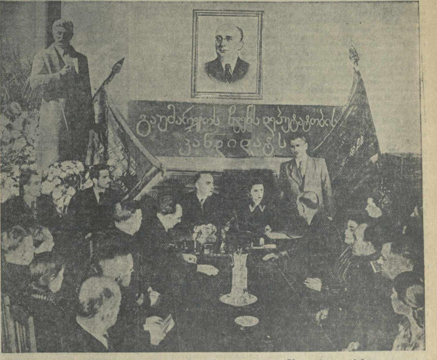
На снимке: заседание 112 окружной избирательной комиссии по выборам в Тбилисский городской Совет депутатов трудящихся. Выступает представитель Грузинского политехнического института имени Кирова профессор Г. Заридзе.