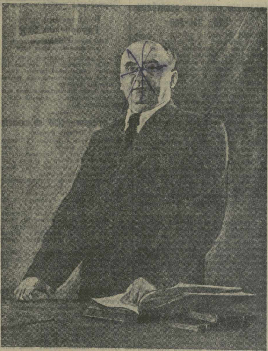
Советского государства Лаврентия Павловича Берия.