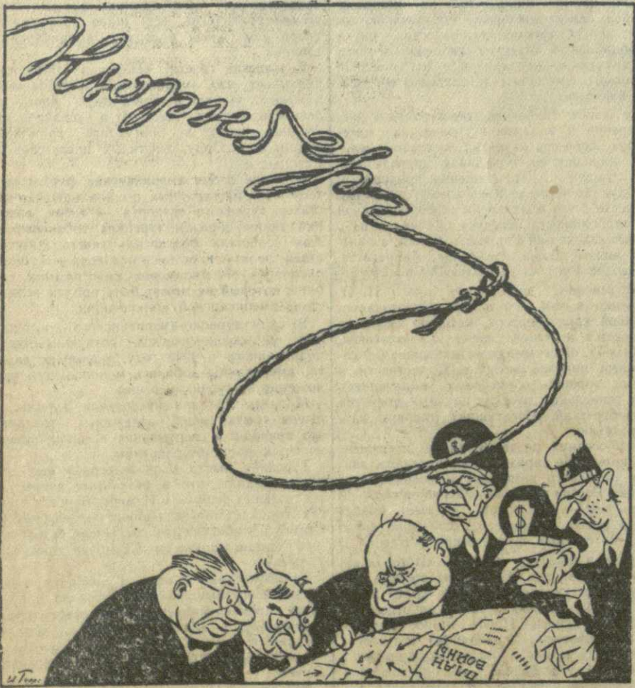
Рис. И. ГУРРО.