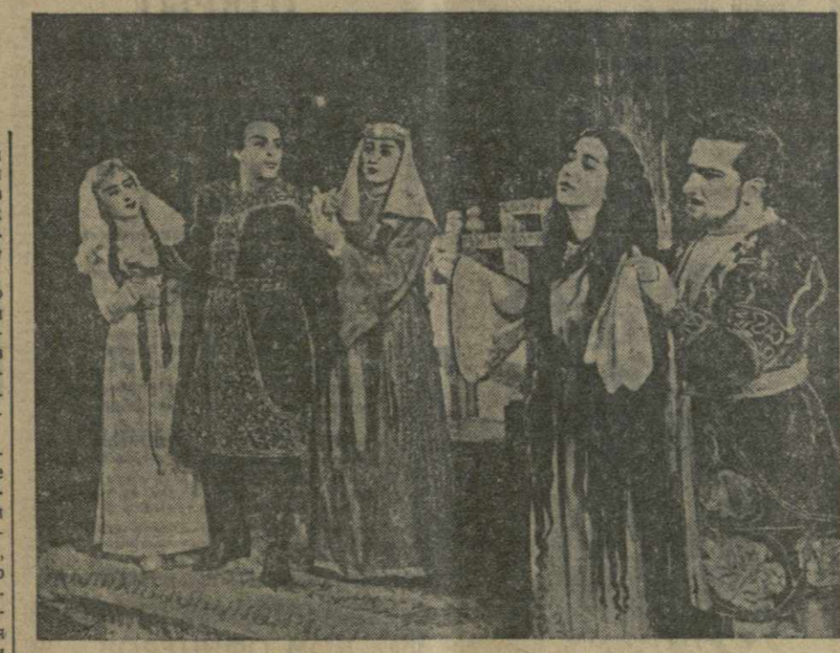
Сцена из III акта оперы „Абесалом и Этери“

ЛОНДОН, 30 ноября. (ТАСС). Национальный совет борьбы за мир (пафистская организация, объединяющая деятельность свыше 40 английских организаций, борющихся за мир, но не входящих в Английский комитет защиты мира.) опубликовал вчера заявление, в котором требует, чтобы английское правительство немедленно дало указания своим представителям в Организации Объединенных Наций приложить все усилия к тому, чтобы по возможности скорее положить конец войне в Корее, установив мир путем переговоров.