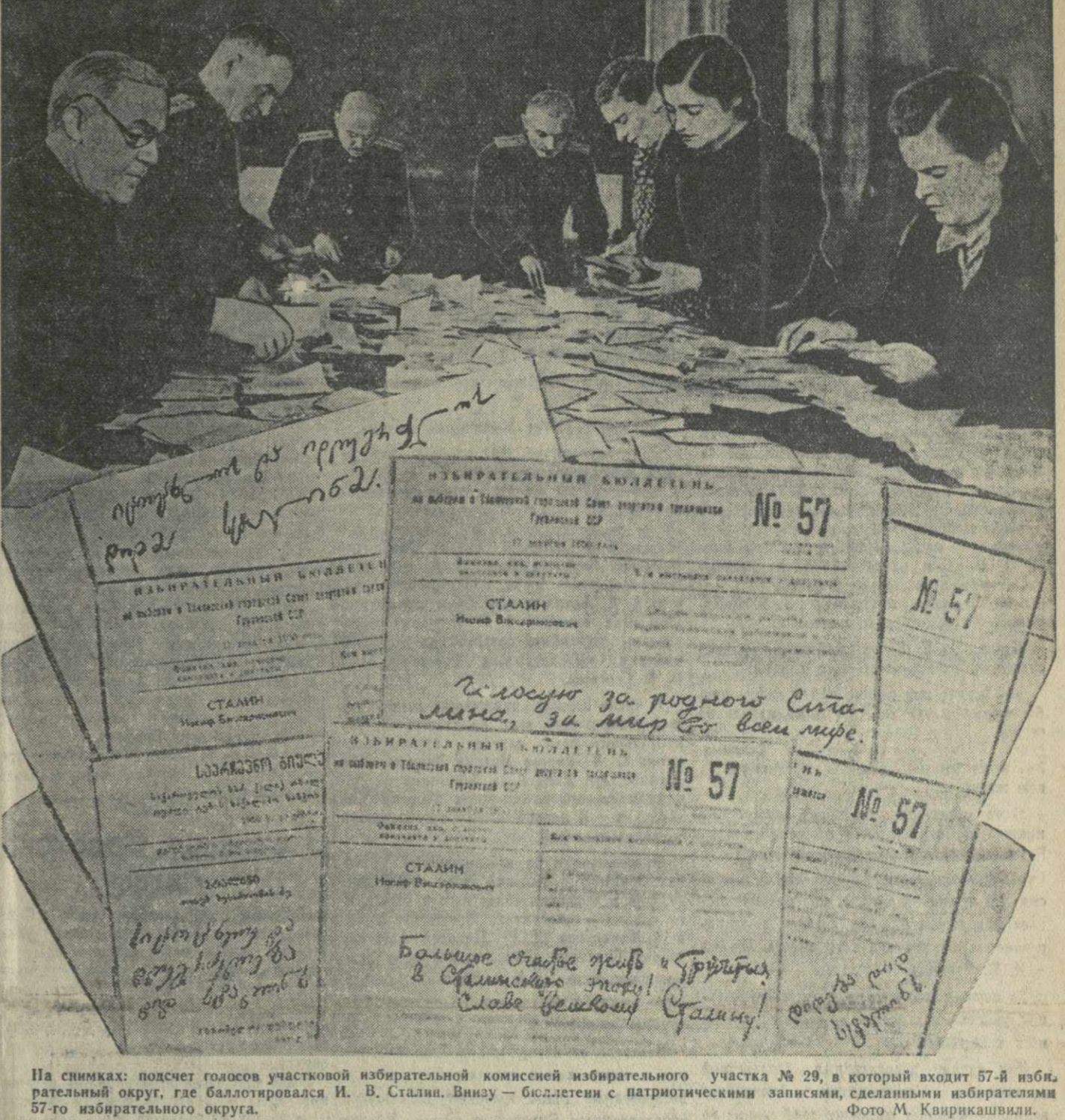
На снимках: подсчет голосов участковой избирательной комиссией избирательного участка № 29, в который входит 57-й избирательный округ, где баллотировался И. В. Сталин. Внизу — бюллетени с патристическими записками, сделанными избирателями

В бюллетенях — и стихотворные строки, славящие товарища Сталина. Все записки проникнуты чувством твердой уверенности советских людей в своем завтрашнем дне. «Голосуя за вождя советского народа