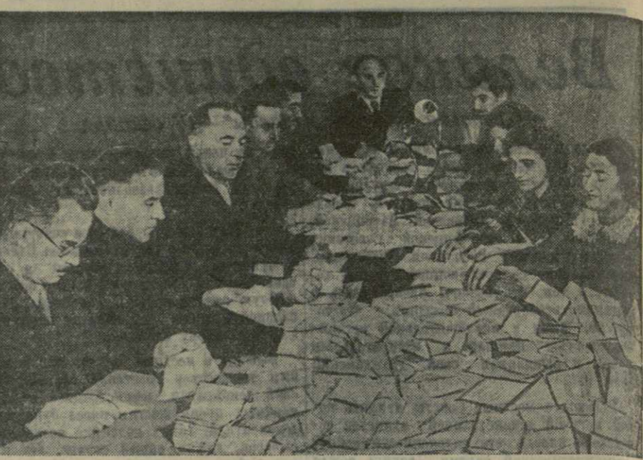
Избирательный участок № 22 Сталинского района. На снимке: участковая избирательная комиссия за подсчетом голосов.

Округ № 237 по выборам в Тбилисский городской Совет. Здесь баллотировался секретарь Центрального Комитета КП(б) Грузии Кандид Несторович Чарквиани. В урне оказалось