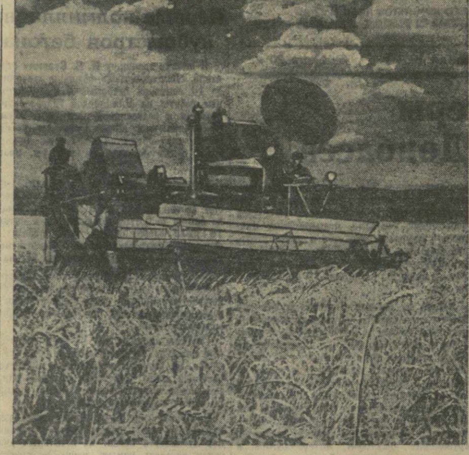
Самоходный комбайн на полях колхоза имени Берия с.а. Мухрани Мцхетского района.

ляется большим количеством комбайнов, работающих на полях. Они будут жать хлеб на площади, превышающей четыре пятых всей посевной площади. В печатаемых ниже корреспонденциях рассказывается о замечательных результатах борьбы за урожай, которых добились карталинские колхозы в содружестве с механизаторами.