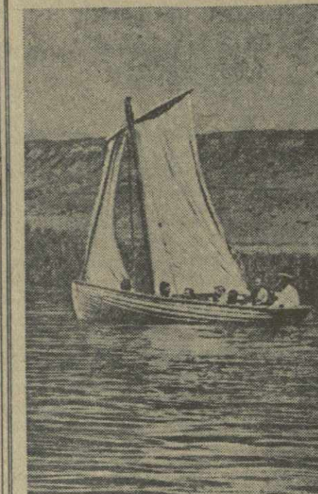
В воскресные дни берега озера Лиси превращаются в оживленный пляж. Сюда, спасаясь от летней жары, приезжают тысячи тбилисцев.

Но не только купание привлекает тбилисцев на Лиси. Местные организации Добровольного общества содействия Военно-Морскому Флоту проводят здесь свои занятия. Досфлотовцы учатся плавать, грести, ходить под парусами.