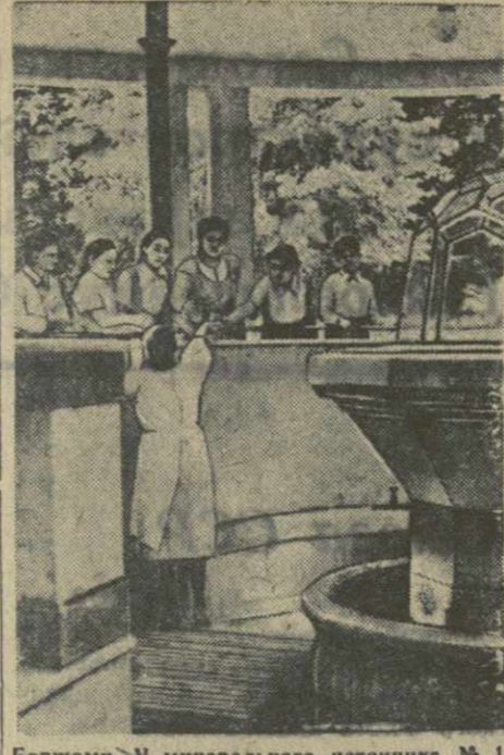
Боржом. У минерального источника № 1.