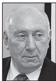
კრძალვითა და მოწიწებით, მიხეილა უბრახელიძე 25 დეკემბერი, 2023 წელი

გულმხურვალედ ვულოცავ ჩვენს ძვირფას პატრიარქს აღსაყდრებიდან 46-ე წლისთავს და დაბადების საიუბილეო თარიღს – 4 იანვარს. ხანგრძლივი და უშფოთველი სიცოცხლე მომადლეობოდეს ღვთისგან ჩვენი ხალხის მიერ აღიარებულ სულიერ წინამძღოლს სამშობლოს საკეთილდღეოდ.