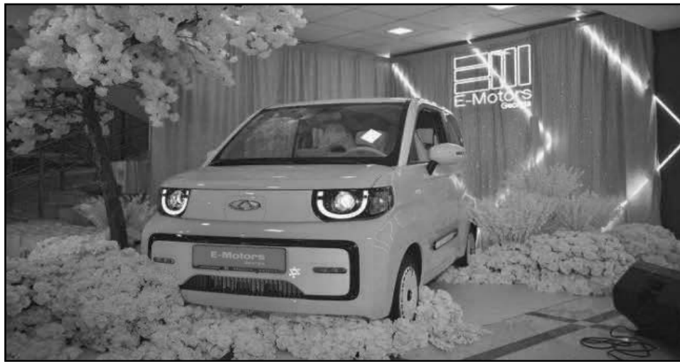
21 დეკემბერს, ბელიაშვილის N49-ში, საქართველოში პირველი - ელექტრომობილების ოფიციალური მულტიბრენდული შოურუმი, E-Motors Georgia, საზეიმო ვითარებაში გაიხსნა.

E-Motors Georgia ჩინური ავტომწარმოებელი ბრენდების ექსკლუზიური პარტნიორია და თავის სივრცეში IM Motors-ის, Jetour-ის, Dayun-ის, Forthing-ის და Chery-ს მოდელებს აერთიანებს. კომპანია იმპორტს პირდაპირ ჩინური ავტომწარმოებლების ქარხნიდან ახორციელებს, ამ ბიზნესმოდელიდან გამომდინარე კი, შოურუმში წარმოდგენილ უახლეს მოდელებზე ფასებიც საკმაოდ ლიბერალურია.