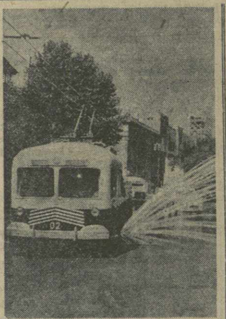
С раннего утра из парка Тбилисского трамвайно-троллейбусного управления выезжают полные троллейбусы и трамваи. Они ежедневно совершают по улицам города несколько десятков рейсов, обильно поливая водой мостовые и тротуары.

● Книжки по продаже медикаментов открыты на улице Ленина Центральным аптекарским магазином № 1.