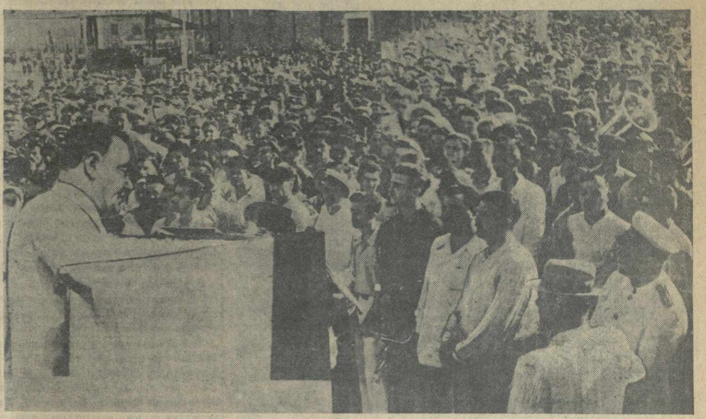
Митинг во дворе Кутаисского автомобильного завода. На трибуне — секретарь Кутаисского городского комитета КП(б) Грузии тов. Г. Нарсия.

Это обязательство под руководством и с помощью ЦК КП(б) Грузии будет выполнено. Коллектив Кутаисского автомобильного завода внесет достойный вклад в дело дальнейшего укрепления экономической мощи советской Родины, в строительство коммунизма в нашей стране.