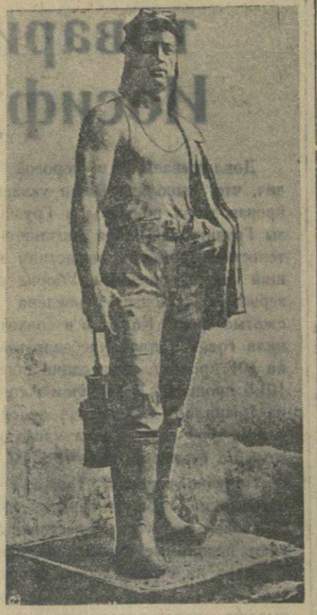
«Шахтер после окончания работы» — скульптура дипломата Тбилисской академии искусств А. А. Чумбурдзе.