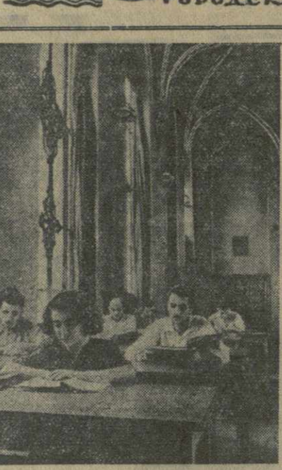
Государственная публичная библиотека Грузии имени Карла Маркса — одна из старейших в стране. В ее книгохранении сейчас насчитывается более двух миллионов книг. В читальных залах и кабинетах библиотеки ежедневно бывает 1.000—1.200 человек. В первом поудольном библиотеке обслуживала около 141.000 читателей, выдала более 400.000 книг и несколько десятков тысяч библиографических справок.

Недавно был произведен капитальный ремонт библиотеки. Сейчас она вновь открылась.