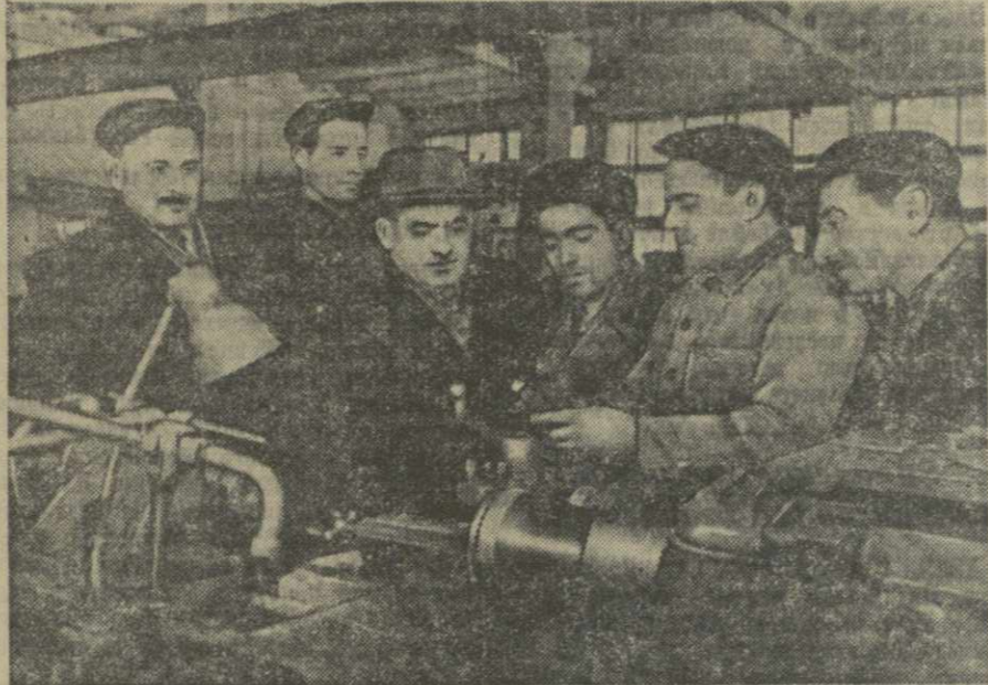
На Батумском машиностроительном заводе побывала делегация рабочих Кирово-Анжуйского машиностроительного завода (Армянская ССР).

БАТУМИ, 2. (Корр. «Зари Востока»). После сентябрьского Пленума ЦК КПСС перед коллективами Батумского и Кирово-Анжуйского машиностроительных заводов стали новые большие задачи.