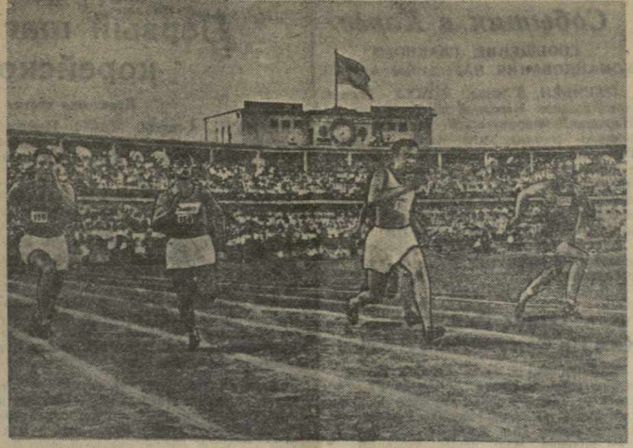
Четвертая спартакиада школьников Грузии. На снимке: один из забегов юниоров на дистанцию 100 метров на стадионе «Динамо» имени Л. П. Берия.