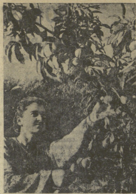
Сбор персиков в колхозе имени Бараташвили села Келасури Сухумского района.