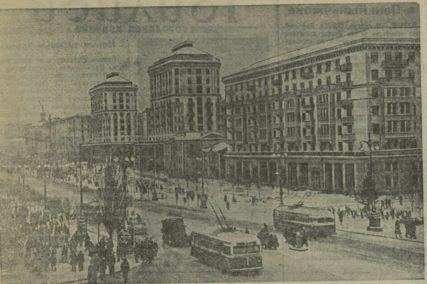
На снимке: Центральный проспект столицы Советской Украины — Крещатик.