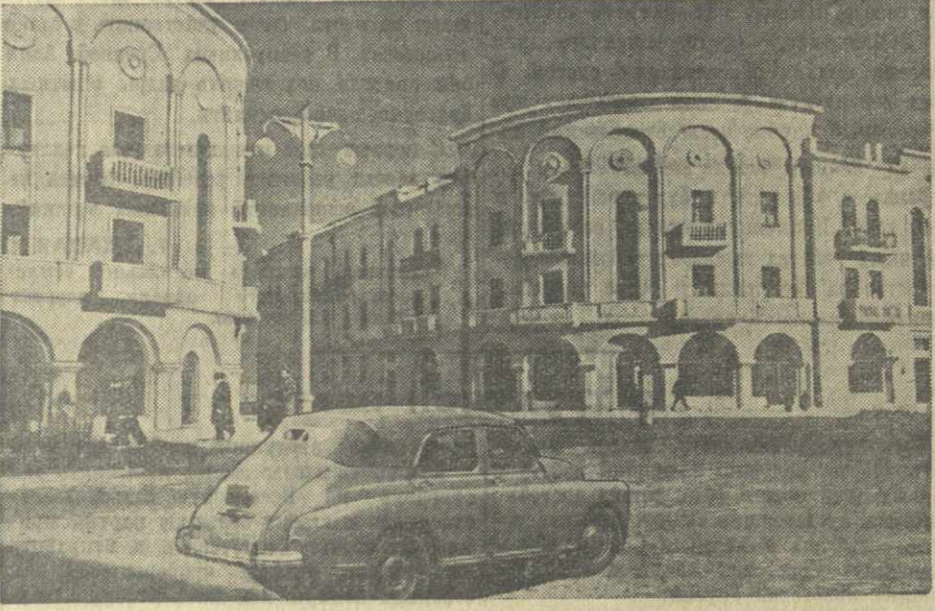
Рустави. На снимке: новые жилые дома для рабочих и служащих Закавказского металлургического завода имени Сталина на Центральном проспекте.