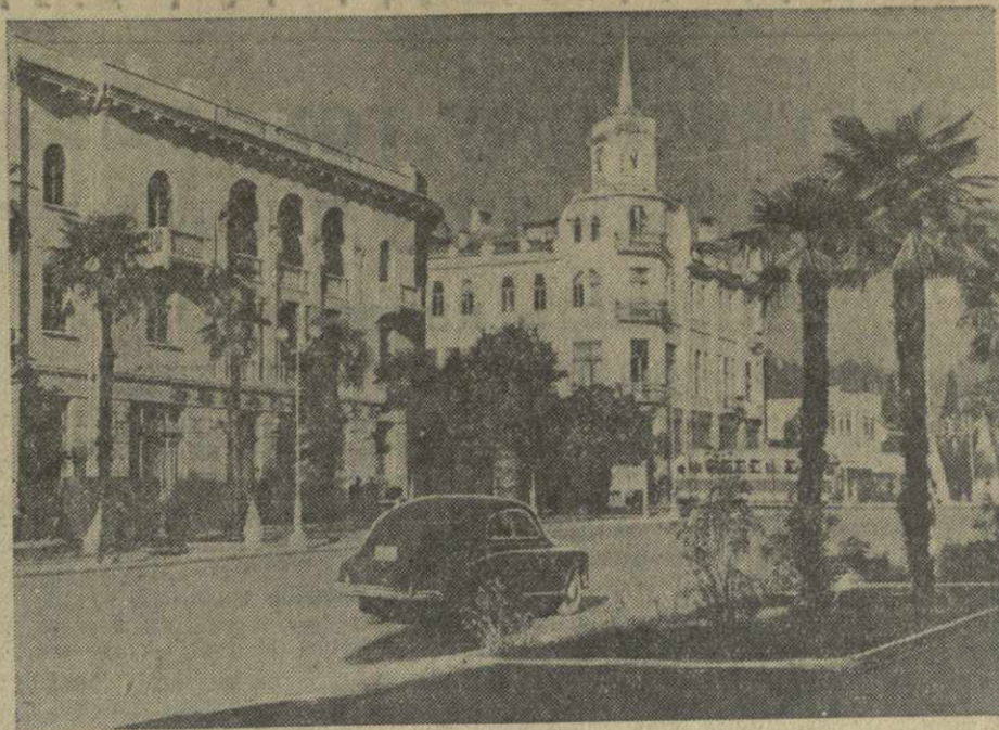
Сухуми. На улице Ленина.

Во время экспедиции был записан на магнитофоне 76 хороших народных песен и 27 плясок, исполняемых на старинном народном инструменте чибони.