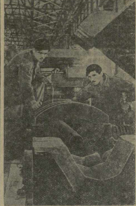
Труборокатный цех Закавказского металлургического завода имени Сталина в Рустави.