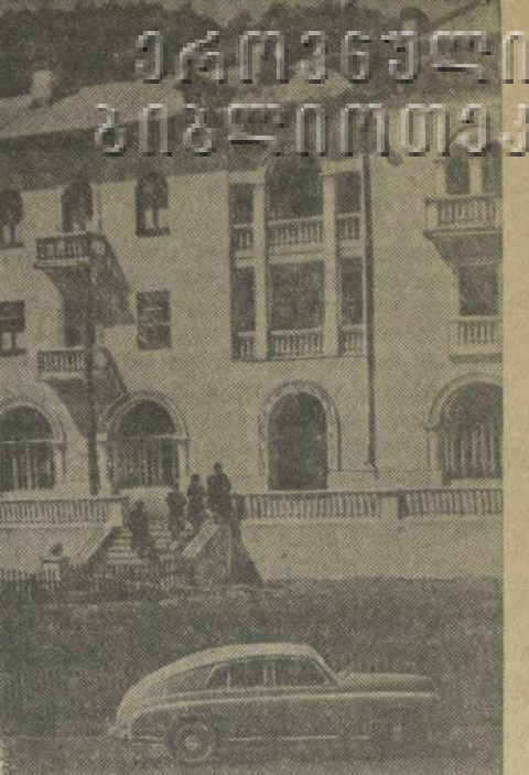
Тбилиси. Новый жилой дом на Сталинской улице.

Во втором семестре во всех высших учебных заведениях вводится изучение материалов XIX съезда КПСС и гениального труда товарища И. В. Сталина «Экономические проблемы социализма в СССР».