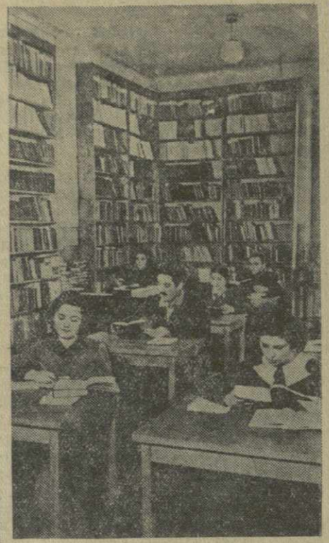
В высших учебных заведениях проходят зимние экзаменационные сессии. Особенно многолюдно в эти дни в студенческих библиотеках. На снимке: в читальном зале библиотеки Педагогического института имени Пушкина.