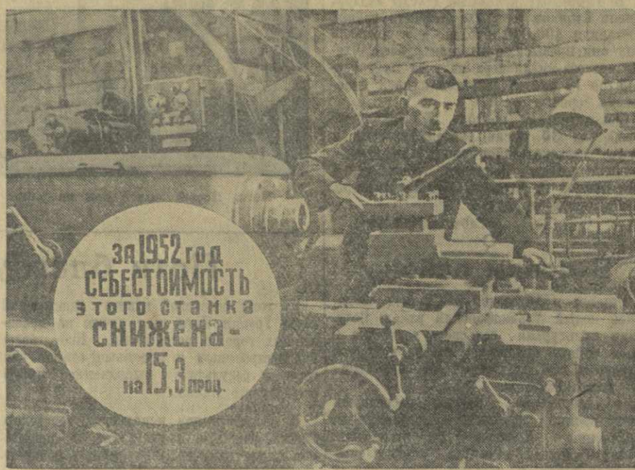
За 1952 год СЕБЕСТОИМСТЬ ЭТОГО СТАНКА СНИЖЕНА на 15,2 проц.

И. Сталин. «Экономические проблемы социализма в СССР».