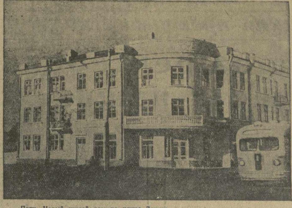
Поти. Новый жилой дом на улице Ленина.

Спектакль поставлен режиссером Г. Кабишвили, художественное оформление Т. Гаглоева.