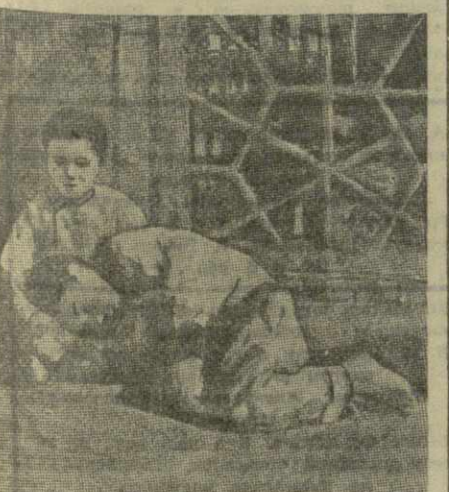
На снимке: бездомные дети спят прямо на улице. Такую картину можно видеть в Анкаре и в других турецких городах.