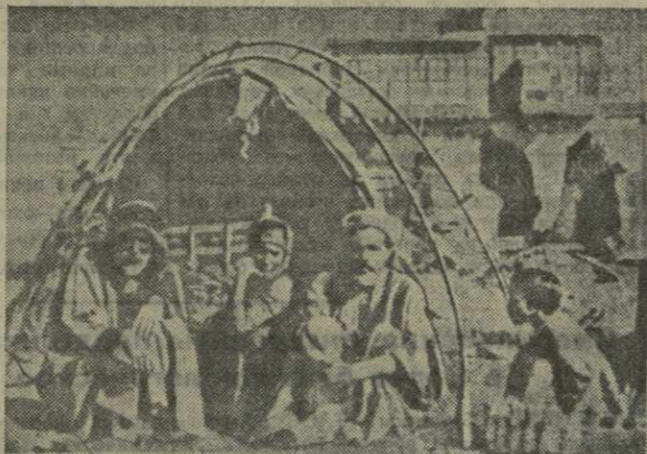
На окраинах Багдада появляются новые и новые лагеря типа поселения сельских жителей, сбывавшихся в город от гнета помещиков.

Много сказок и преданий окутывает древний город Багдад. В давние времена он был крупным центром ремесленного производства и транзитной торговли, одним из важнейших центров арабской феодальной культуры. На багдадском базаре торговали купцы почти со всех концов мира.