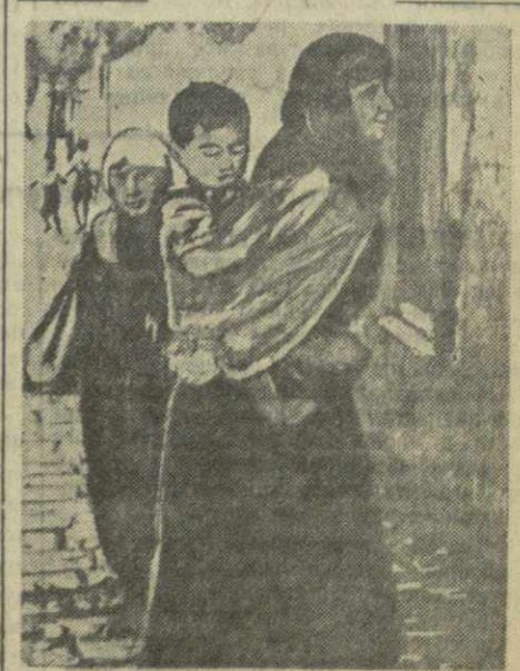
Нищая женщина с двумя детьми просит подаяние на одной из центральных улиц Анкары.