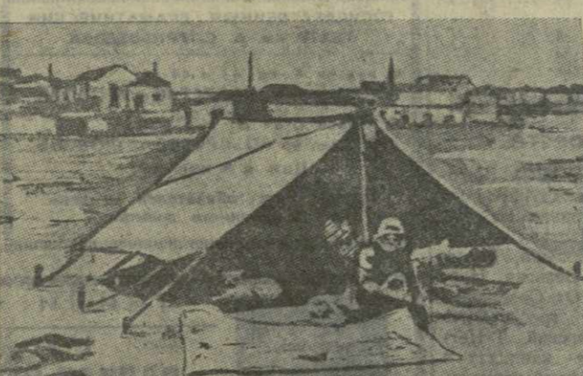
На снимке: жилище в палатке в районе гор. Анкары Чынгын Баглары.

— В нашей семье, — говорит другой рабочий, — месяцами не бывает мяса. Пища состоит из овощей, шпеничной кру-