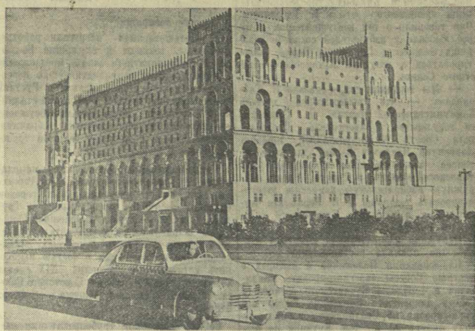
Баку. Дом правительства Азербайджанской ССР.

Новые избирательные округа образованы далеко в море, где трудятся героические коллективы морского промысла «Нефтяные камни». Два года назад здесь было безлюдно. Лишь несколько буровых бригад — разведчиков нефти — работали далеко от берега. Ныне «Нефтяные камни» — один из крупнейших промыслов треста Горганнефть — дают черного золота больше, чем некоторые старые бакинские промыслы. Значительно переоснащены за последние два года, коллектив промысла добыл сверх плана десятки тысяч тонн горючего. В короткий срок на искусственном острове построены новые двухэтажные жилые дома, клубы, библиотека, де-