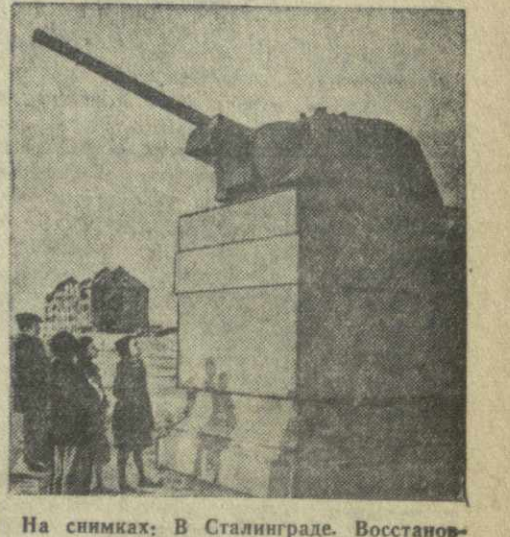
На снимках: В Сталинираде. Восстановленное и реконструированное здание областного драматического театра имени М. Горького на площади Павших борцов. Рядом— новое здание универмага. В подвале этого здания был пленен вместе со своим штабом командующий группой немецко-фашистских войск под Сталиниром генерал Паулюс. Визу—у исторического памятника на месте, где проходила линия обороны Сталинграда. Фото А. Макленова (Фотохроника ТАСС) и М. Квиришвили.