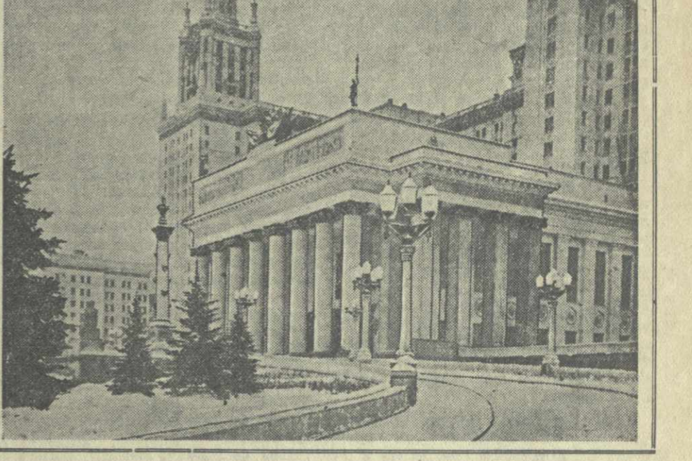
Концерты артистов братских республик

БАКУ, 2 февраля. (ТАСС). Вчера в Азербайджанской филармонии состоялось первое выступление ансамбля народного танца Молдавской ССР. Нефтяники Сталинского района в своем Дворце культуры присутствовали на концерте Ансамбля народной песни и пляски Армянской ССР. Выступления творческих коллективов братских республик пользуются неизменным успехом у трудящихся города. За последние время бакинцы познакомились с искусством уральского и воронежского русских народных хором.