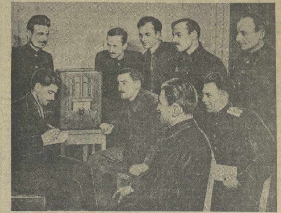
Вчера вечером на Тбилисском паровозо-вагоноремонтном заводе имени Сталина. На снимке: рабочие сборочного цеха слушают по радио постановление о новом снижении цен на продовольственные и промышленные товары.