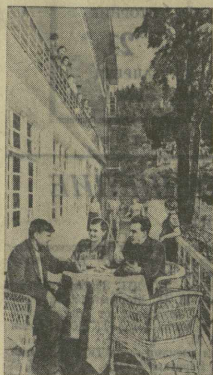
В Аджарии открылся курортный сезон. В санатории и дома отдыха Цихидзри, Кобулет, Махинджаури и на Зеленом Мысу приехали на отдых трудящиеся со всех концов страны.