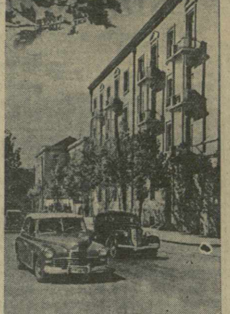
Улица Палишвили возникла недавно. За короткое время на месте пустыря построены красивые многоэтажные жилые дома «Грузахострой».

Исторический Тбилисский городской Совет продолжает проектирование строительства продолжения набережной на левом берегу Куры.