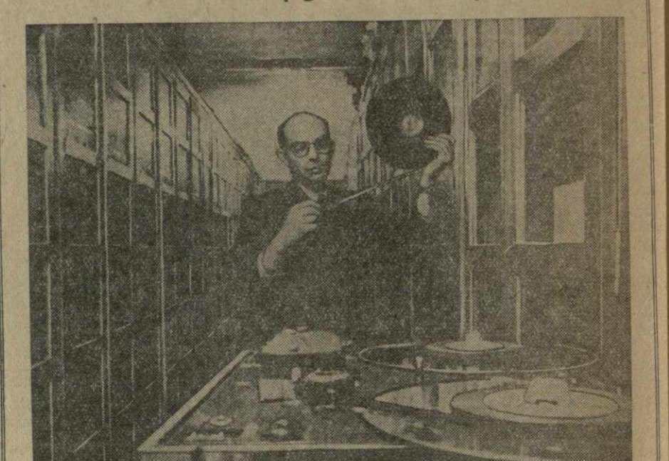
Фонотека Грузинского радио

В высоких стеклянных шкафах аккуратно размещены тысячи небольших картонных футляров. В них хранятся магнитофонные пленки с записями спектаклей, опер, музыкальных и литературных произведений. Это — фонотека Грузинского радио.