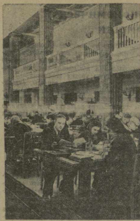
Москва. В Государственной библиотеке СССР имени В. И. Ленина открыт новый корпус. Здесь размещены два читальных зала. Один из них, большой, будет обслуживать около 300 читателей. Другой предназначен для посетителей отдела редкой книги.

На снимке: в новом читальном зале.