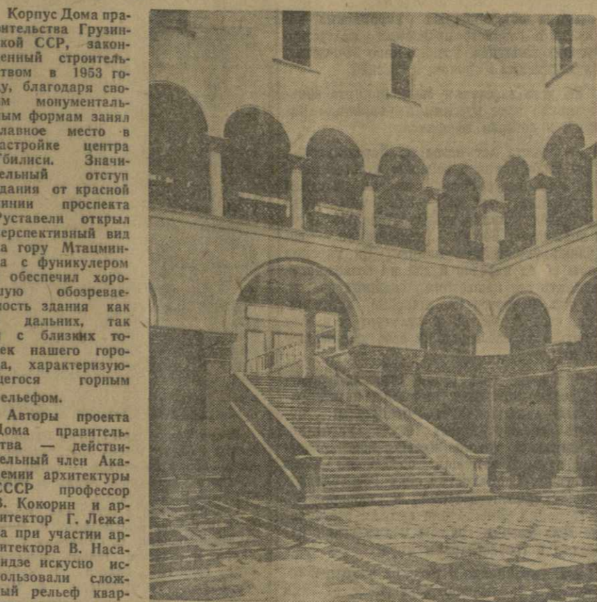
Дом правительства Грузинской ССР. Вестибюль помещения Совета Министров.

Корпус Дома правительства Грузинской ССР, законченный строительством в 1953 году, благодаря своим монументальным формам занял главное место в застройке центра Тбилиси. Значительный отступ здания от красной линии проспекта Руставели открыл перспективный вид на гору Мтацминда с фрункулером и обеспечил хорошую обзорность здания как с дальних, так и с близких точек нашего города, характеризующегося горным рельефом.