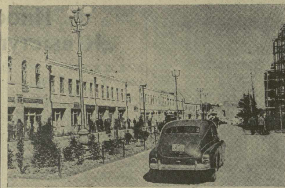
Тбилиси. Улица имени Ленина.