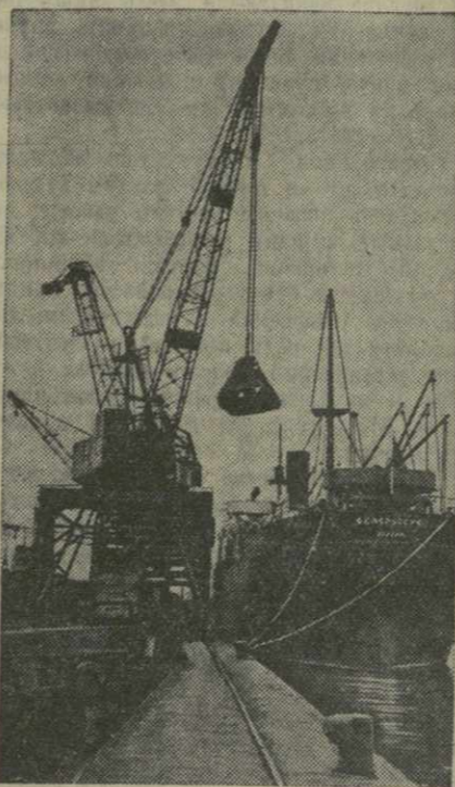
Тысячи тонн высококачественного марганца дают стране рудники Чигатура.

Самоотверженным трудом на благо Родины отвечает грузинский народ на первомайские Призывы ЦК КПСС