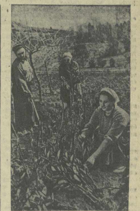
Колхозники сельхозартели села Гаптанли Батумского района готовят в цитрусовом питомнике к будущим посадкам свыше 50.000 саженцев мандаринов, апельсинов и лимон.

Гурджаани, 29. (Морр. «Зари Востока»). Колхозники артели имени Сталина села Шрома досрочно выполнили обязательства, взятые в честь первомайского праздника.