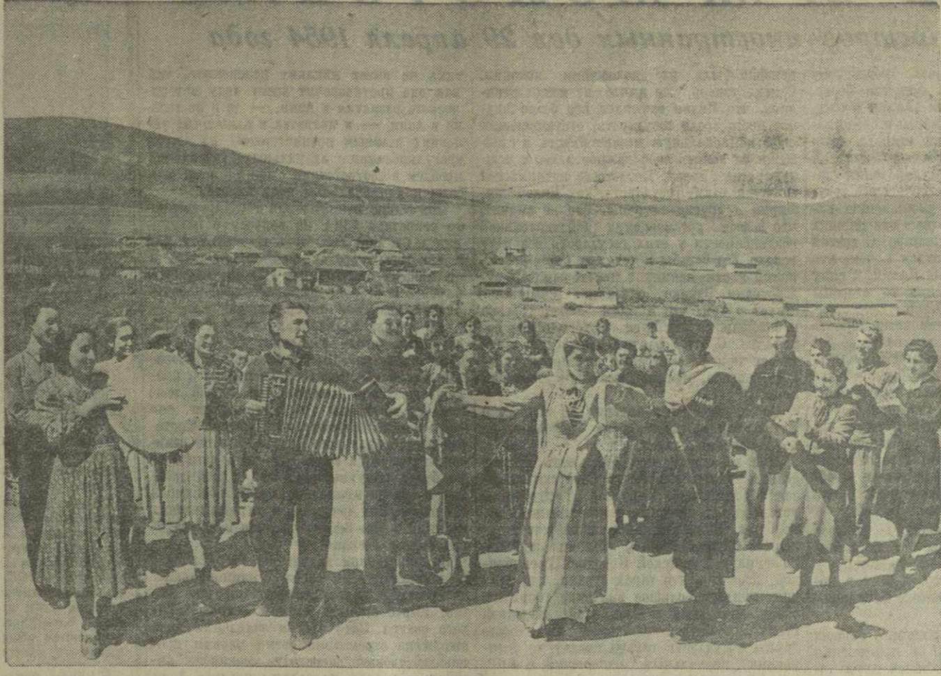
ТЕПЛОЕ майское солнце щедро залило своими лучами горы и долины, поля и сады Юго-Осетии, где царит мирный созидательный труд советских людей.