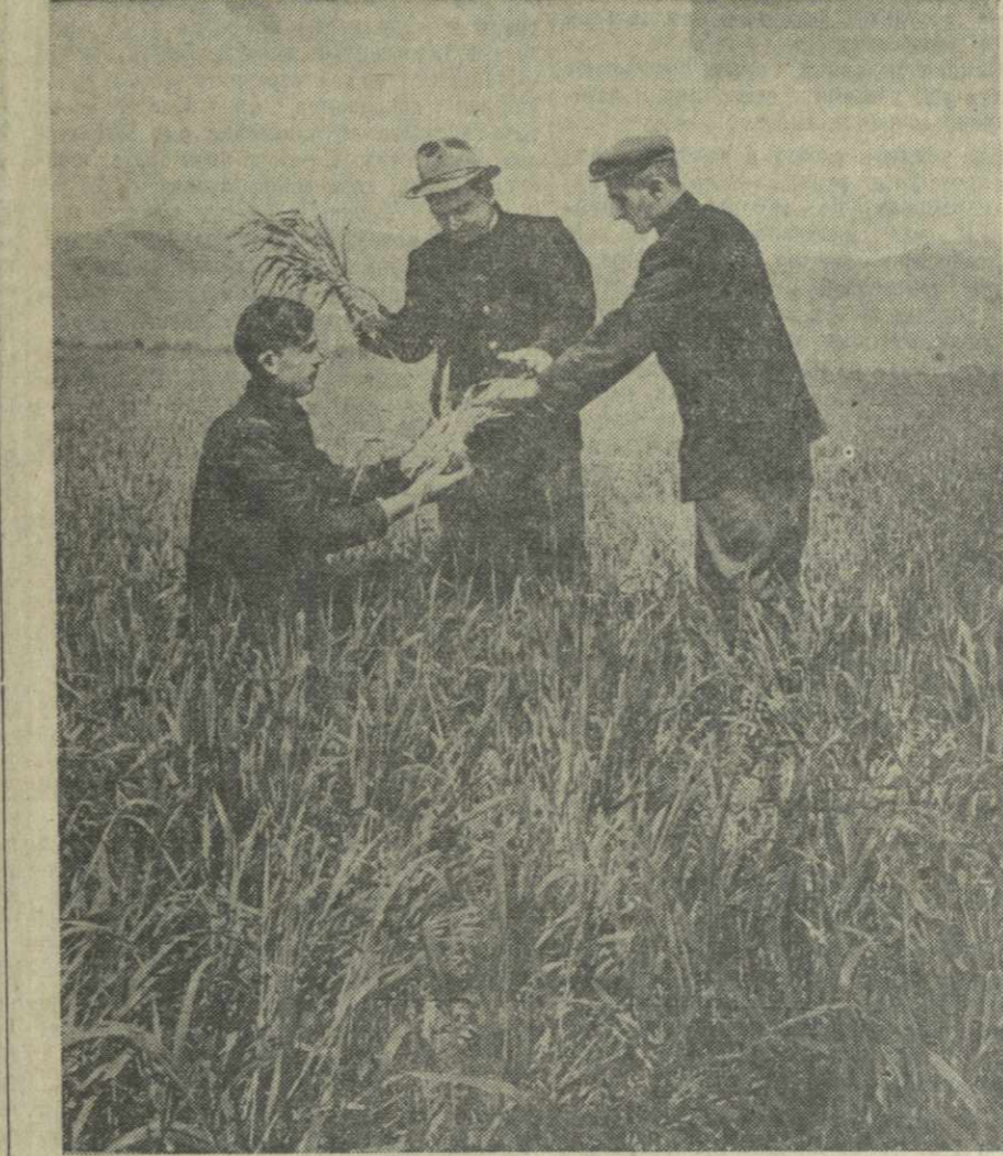
Колхоз «Ленинск андердзи» Лагодзского района ежегодно выращивает обильный урожай зерновых...