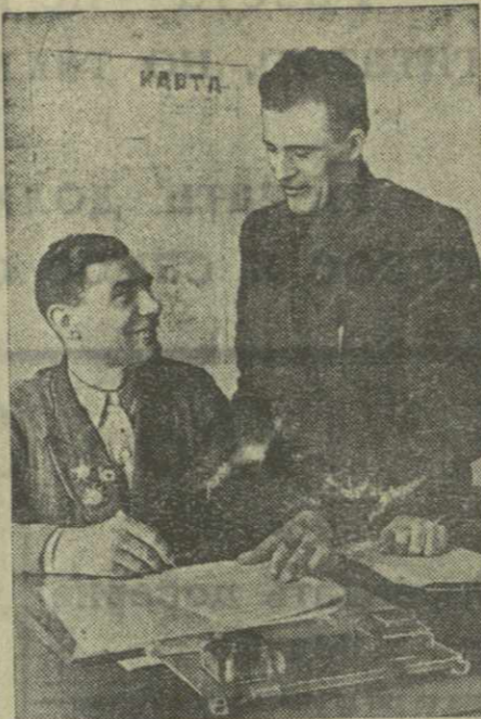
Иван Мачабели.