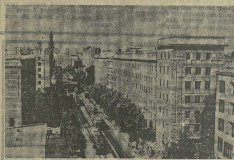
На снимке: Маршалковская улица в Варшаве.

Другая большая стройка Варшавы — трасса «Восток—Запад» была сооружена в рекордно-короткий срок — в два года. Она протянулась на семь километров, соединив восточное предместье Варшавы — Прагу — с ее западной окраиной. Широкая асфальтированная магистраль пролегала через весь город, широта через Вис-