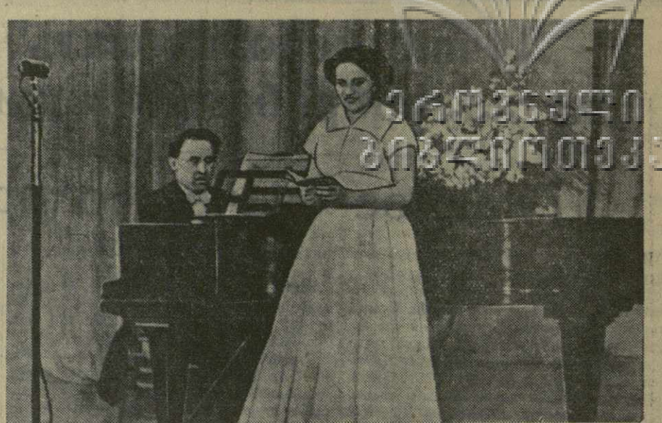
На снимке: выступление заслуженной артистки Армянской ССР, лауреата Сталинской премии, Зары Долухановой в летнем театре филармонии.

ЛОНДОН, 8 июня. (ТАСС). Корреспондент агентства Рейтер передает из Токио, что, по данным японской полиции, вчера во время тайфуна в Южной Японии погибло 29, ранено 40 и пропало без вести 15 человек.