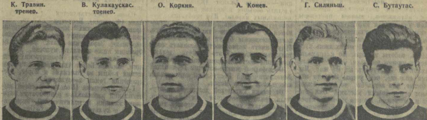
ПЕРВЕНСТВО СССР ПО ФУТБОЛУ