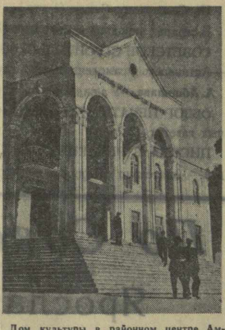
Дом культуры в районном центре Абраураури.