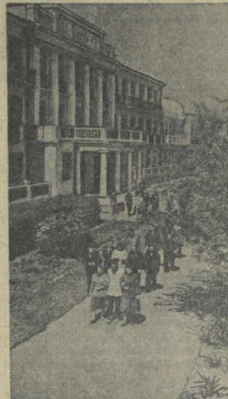
Свыше ста тысяч трудящихся ежегодно отдыхают в здравницах Одессы. Только в санаториях Одесского курортного управления ВЦСПС отдохнут в этом году 38 тысяч человек.

Закарпатский народный хор выехал на Дальний Восток. Он даст концерты в городах Приморья и на Сахалине. Ансамбль песни и пляски узбекской филармонии совершит поездки по городам Казахстана, Сибири и Урала. Хор северной песни — по городам Поволжья и Северного Кавказа. Ансамбли, хоры, оркестры, музыканты и певцы дадут на различных эстрадах страны четыре тысячи концертов. (ТАСС).