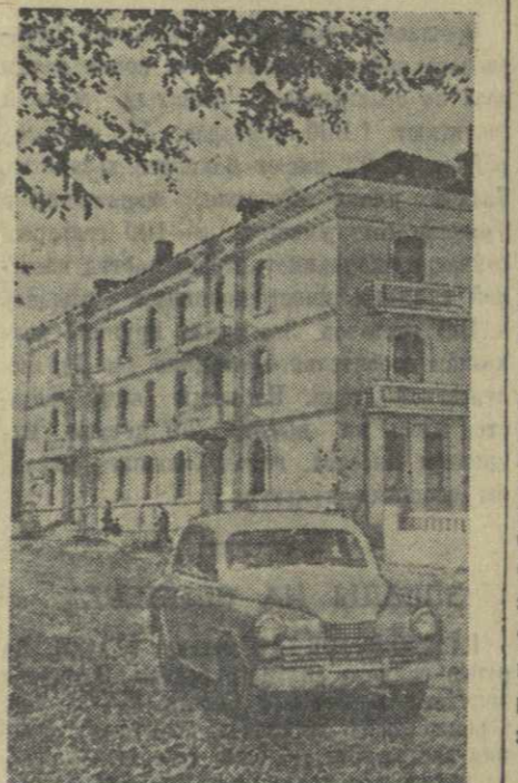
Цител-Цкаро. Новый жилой дом на улице Маленкова.

В нынешнем году техникум закончит 252 человека.