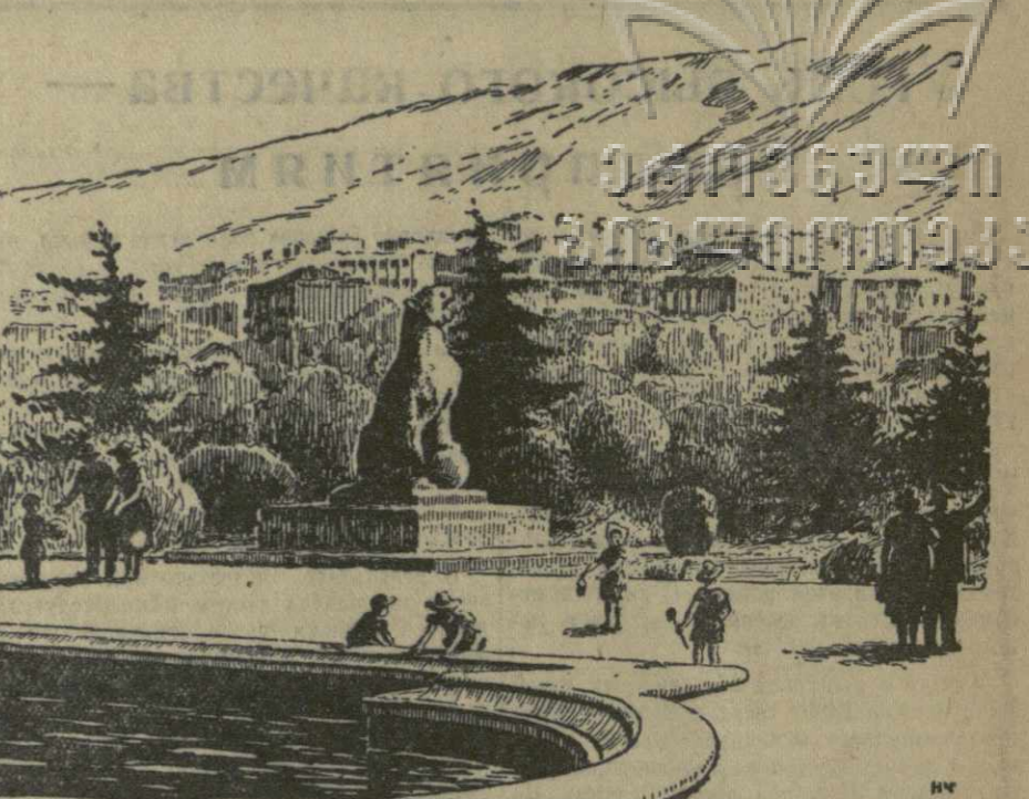
Более 130 гектаров занимает крупнейший в Тбилиси парк в Ваке. В парке насчитывается сейчас более 200.000 деревьев и кустов. Хорошо прижились здесь многолетние липы, клены, дубы, кедры, различные хвойные и декоративные растения. Обильно цвели нынешней весной яблони, груши, вишни, персики. На рисунке — один из уголков парка в Ваке. Из городских зарисовок художника Н. Чернышкова.

НЬЮ-Йорк, 9 июня. (ТАСС). По сообщению агентства Ассошиэйтед Пресс, в результате ураганов, пронесшихся 8 июня над юго-восточной частью штата Мичиган и северо-западной частью штата Огайо, погибло более ста и ранено свыше 200 человек. Наиболее сильный ураган пронесся над городом Флинт (штат Мичиган), разрушив 40 домов в районе, где живут рабочие автомобильного завода.