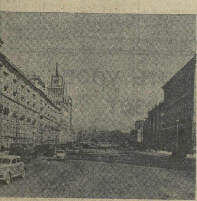
Москва. Большая Саловая улица.

В Москве широко развернулись работы по посадке цветов-летников. В 36 скверах и на бульварах высаживаются свыше одного миллиона четырехсот тысяч растений. Больше двухсот тысяч цветов уже высажено в грунт.