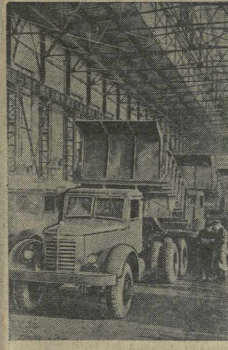
Ярославский автомобильный завод выпускает 10-тонные автомашинки «ЯАЗ-210-Е» для строительства Кубышевского и Сталинградского ГЭС.

В ближайшие дни фильм выйдет на экраны кинотеатров страны. (ТАСС).