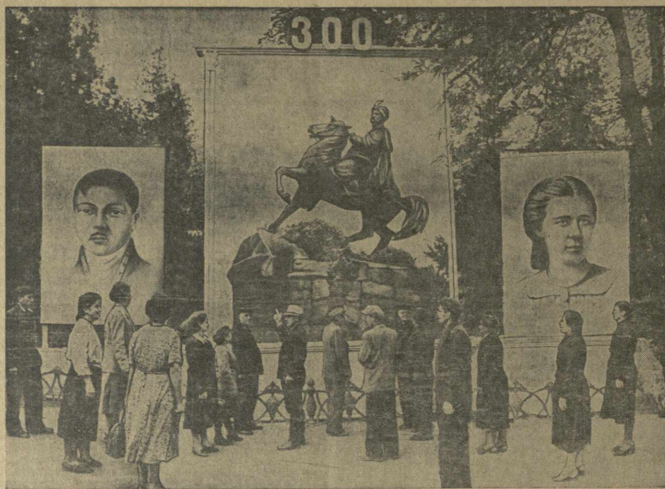
Посетители Центрального парка культуры и отдыха имени С. Орджоникидзе осматривают художественный стенд, посвященный 300-летию воссоединения Украины с Россией.

В Тбилиси около 100 парков, садов, скверов. В летнее время они привлекают тысячи людей. Многие парки и сады стали излюбленным местом отдыха трудящихся. Особенно многолюдно бывает по вечерам и в воскресные дни в парках культуры и отдыха имени Сталина и имени Орджоникидзе, в Ботаническом саду, в саду Коммунаров и других. Жители Тбилиси приходят сюда, чтобы отдохнуть в тенистых аллеях, культурно и весело провести свой досуг. Более 20.000 человек бывает в парке выходных дней и по воскресеньям в Центральном парке культуры и отдыха имени Орджоникидзе, занимающем площадь в 16 гектаров. К услугам посетителей этого парка — летний театр, кино, танцевальная и спортивная площадки, библиотека и читальня, аттракционы, настольные игры.