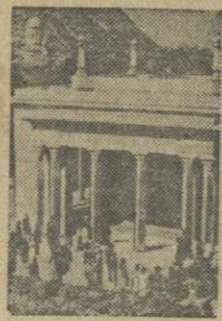
Гора. Дом-музей И. В. Сталина.

Ранним воскресным утром можно увидеть, как от заводских ворот тбилисских предприятий, от зданий учреждений и учебных заведений отходят открытые голубые автобусы, комфортабельно оборудованные мягкими, обитыми кожей креслами для сидения. Эти машины принадлежат Тбилисской экскурсионно-туристской базе Грузинского туристско-экскурсионного управления ВЦСПС.