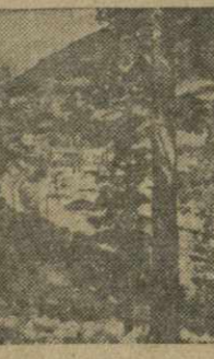
Один из уголков Боржом.

Исполком Тбилисского городского Совета депутатов трудящихся, культурно-просветительные, торговые, автотранспортные и другие организации, связанные с обслуживанием трудящихся, должны сделать все для того, чтобы имеющиеся возможности для воскресного отдыха в пригородных местах и окрестностях Тбилиси были использованы с максимальной полнотой.