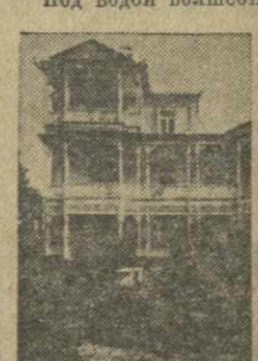
Сагурамо. Дом-музей Илии Чавчавадзе.

Говорят, есть людья золотая В Базалетском озере на дне. Говорят, цветет, не отвечает, Под водой волшебный сад над ней.