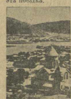
Гор. Михета. Памятник древней грузинской архитектуры.

Большой популярностью среди трудящихся Тбилиси пользуется экскурсионный маршрут Тбилиси — Сагурамо. Рабочим механического цеха Тбилисского паровозогорючего завода имени Сталина, совершившим в минувшее воскресенье экскурсию в Сагурамо, надолго запомнится эта поездка.