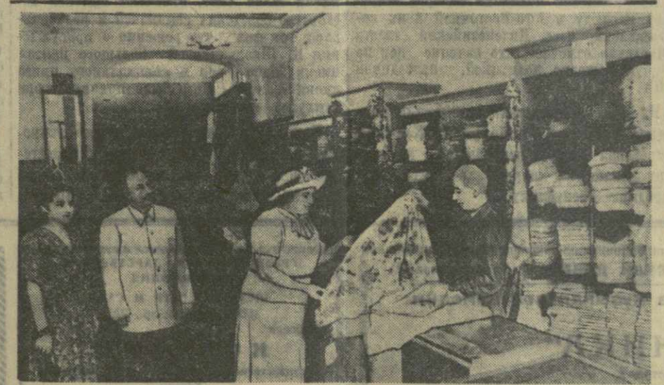
В универсаме № 1 Тбилисморторга.

В магазине № 12 специализированного торгового «Грузобувь» также был обнаружен журнал спроса, но без единой записи. Между тем спрос потребителей, в особенно-