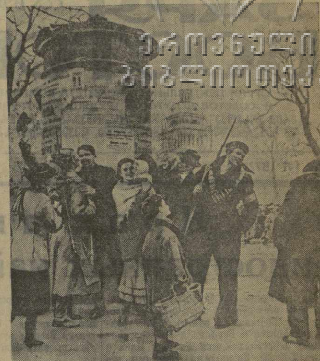
Картина «Первое слово Советской власти». Работа художника Н. И. Осенева.

Интересны образцы жанровой скульптуры. Среди них особенно следует отметить