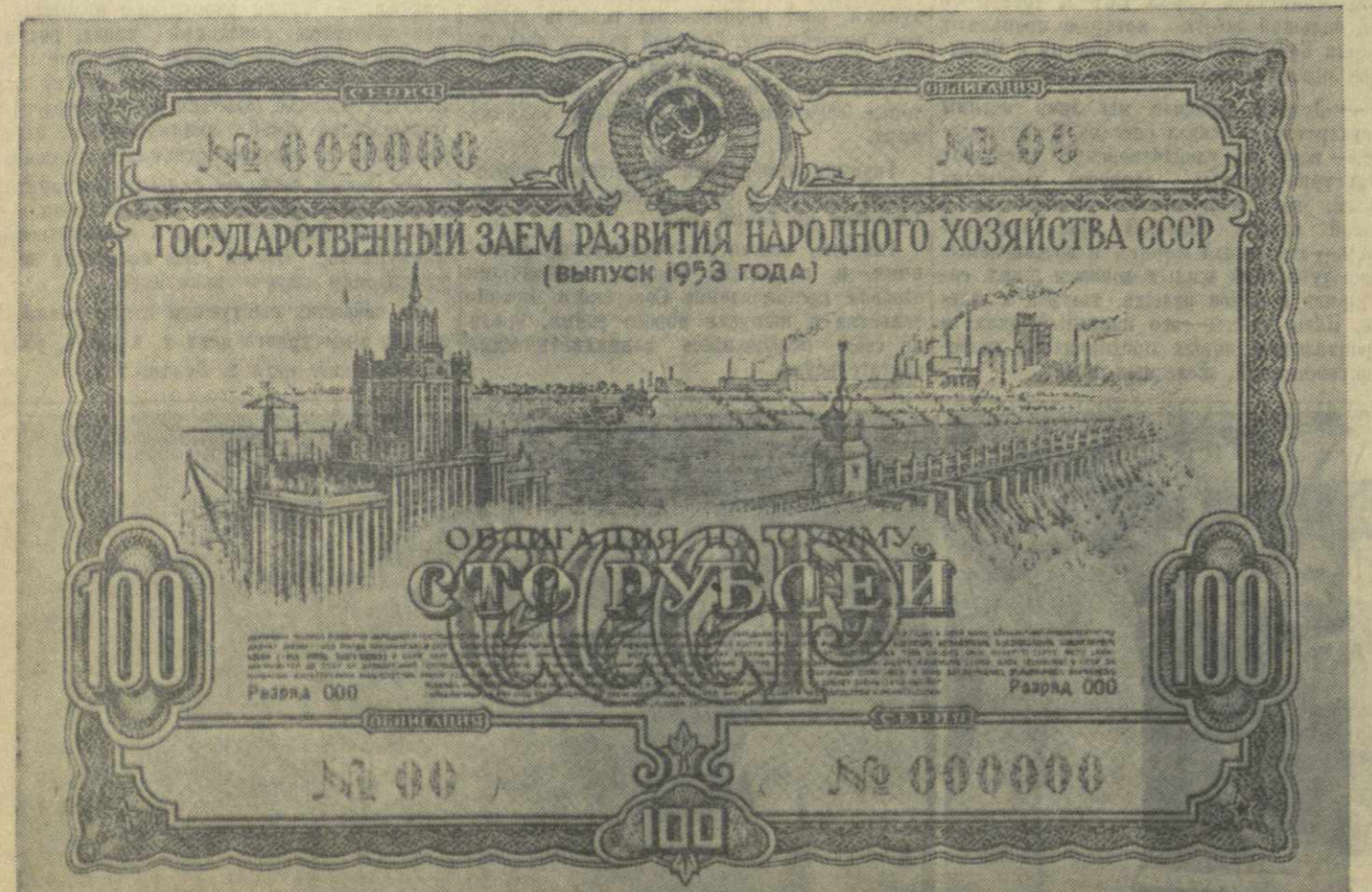
Образцы облигаций Государственного займа развития народного хозяйства СССР (выпуск 1953 года) достоинством в сто рублей.

Делегация пробудет в Грузии три дня. (ГрузТА).