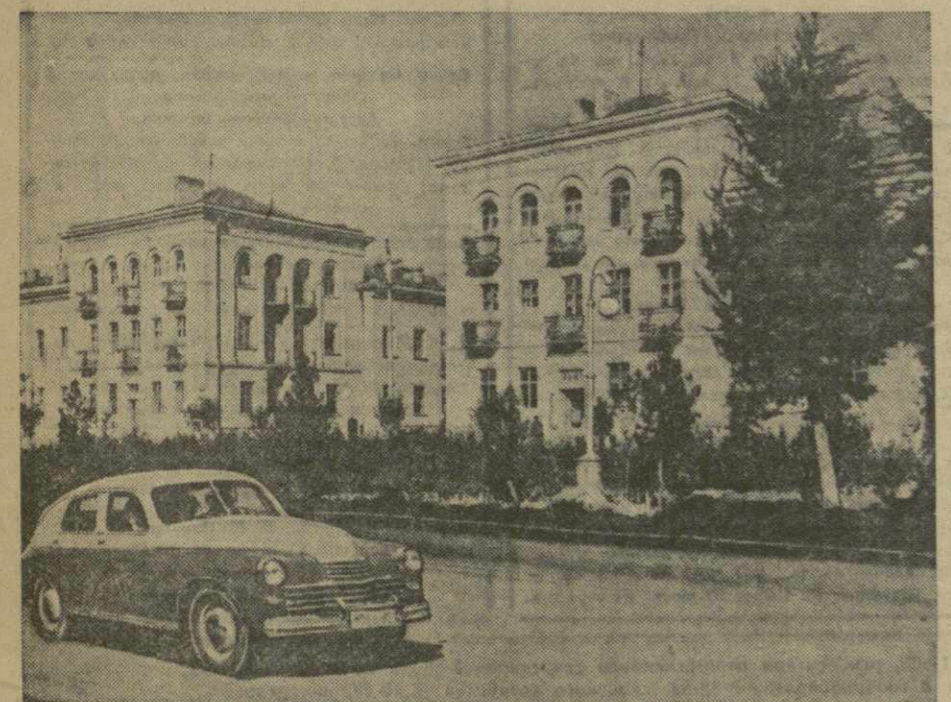
Русгани. Новые жилые дома для металлургов Закавказского металлургического завода имени Сталина.

Редакция направила в Министерство промышленности строительных материалов Грузинской ССР письмо, в котором вскрывались факты плохого хозяйственного руководства на Цигеджарийском известковом заводе. Как сообщает замести-