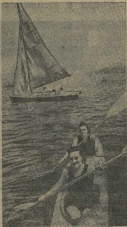
Батуми. На водной станции «Динамо».