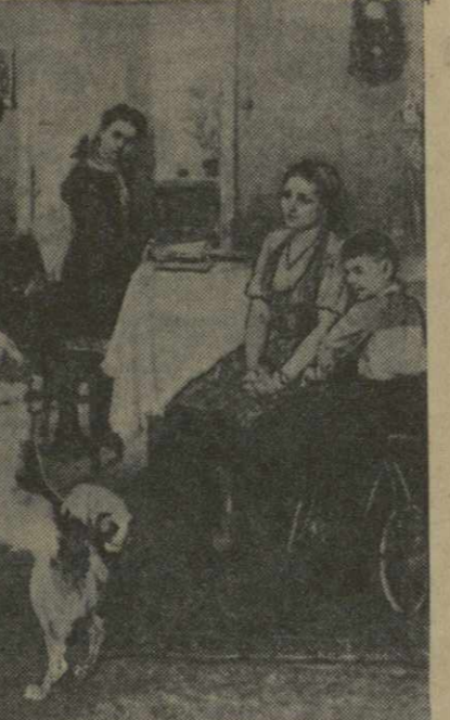
Тысячи тбилисцев побывали уже в залах Государственного музея Грузии, знакомясь с открывшейся недавно передвижной экспозицией Всесоюзной художественной выставки 1952 года. Всеобщее внимание привлекает картина лауреата Сталинской премии Ф. Решетникова «Опять двойка». На снимке: репродукция к картины.