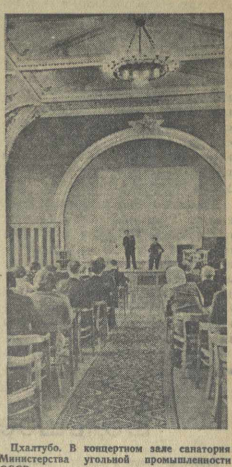
Пхалтубо. В концертном зале санатория Министерства угольной промышленности СССР.