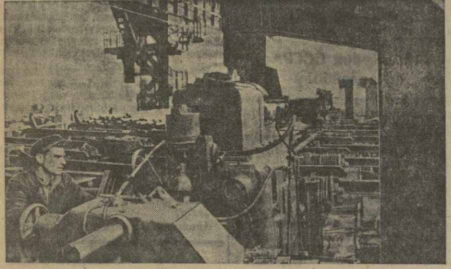
Рустави. В трубопрокатном цехе Закавказского металлургического завода имени Сталина установлены труборезные станки, изготовленные Тбилиским станкозаводом имени Кирова. Коллектив цеха успешно освоил новые станки.