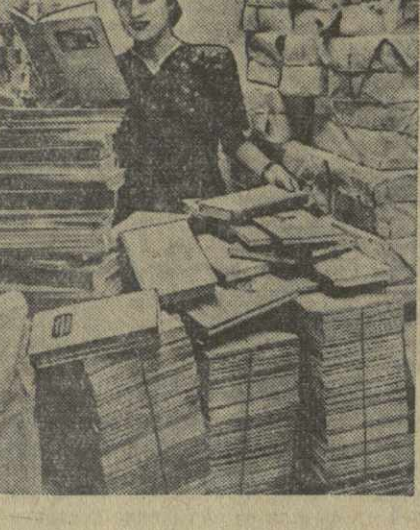
На снимках: 1. В типографии Комбината печати. С машинами шодят оттиски первой части учебника «Деда эна». 2. На складе книжной базы «Сакцигна». Готова к отправке очередная партия учебников.

Ежедневно типографии Тбилиси выпускают тысячи экземпляров учебников для начальных и средних школ республики. На днях Комбинат печати закончил работу над выпуском 50 тысяч экземпляров первой части учебника для начальной школы — «Деда эна». К новому учебному году Государственное издательство Грузии уже выпустило 64 наименования учебников общим тиражом 1.513.000 экземпляров. К 1 августа будет выпущено еще около одного миллиона экземпляров учебников 44 наименований. На базу книготоргового объединения «Сакцигна» ежедневно прибывает большое количество учебников, отпечатанных в типографиях Москвы, Ленинграда, Баку и Еревана, на русском, азербайджанском и армянском языках. К новому учебному году сюда поступит 258 различных учебников в количестве более миллиона экземпляров.