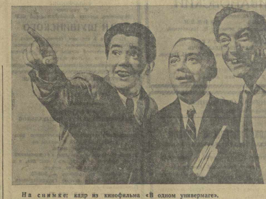
На снимке: кадр из кинофильма «В одном универсаме».

Федерация женщин города Сантоса в письме председателю муниципальной палаты потребовала, чтобы палата заявила протест против прибытия в порт американских военных кораблей. Дочери порта Сантос заявили: «Пусть американцы остаются у себя дома».