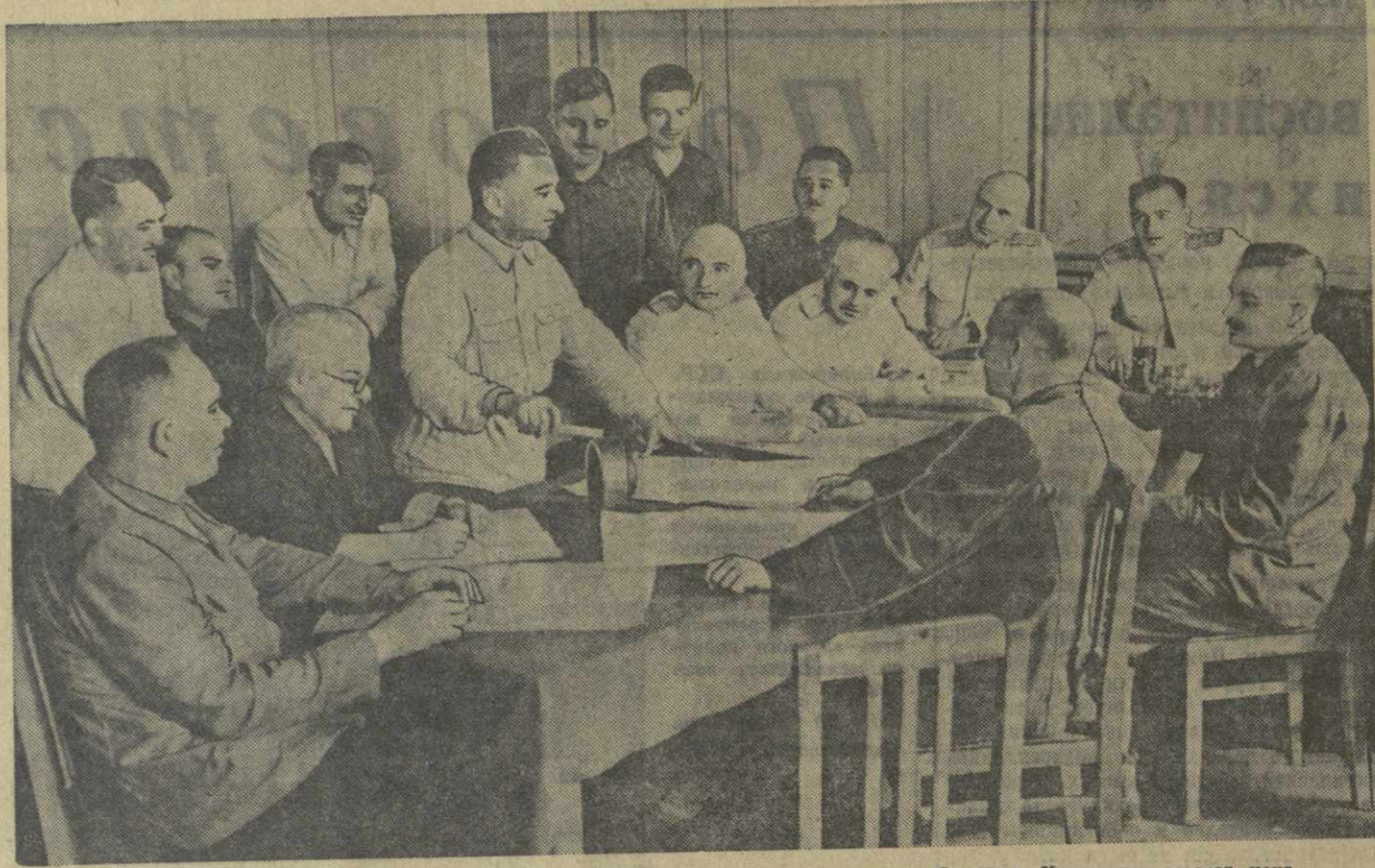
Заседание технического совета на паровозо-вагоноремонтном заводе имени Сталина. Коммунист мастера цеха Ш. Заалишвили вносит предложение.

Г. КАНЧАВЕЛИ, директор Грузинского шиферного завода.