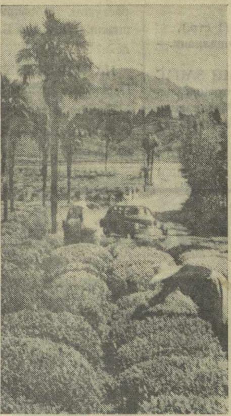
На одном из участков чайных плантаций Чаквинского чайного совхоза.