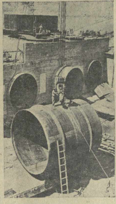
Азербайджанская ССР. Строительство Мингечаурской ГЭС. Монтаж уравнильных башен.

В Москве на центральном стадионе «Динамо» закончились соревнования на «Кубок СССР» по баскетболу для мужских и женских команд. Право участвовать в финале среди женских команд завоевали московские коллективы спортивных обществ «Динамо» и «Строитель». Составление между ними закончилось со счетом 53:34 в пользу спортсменок «Динамо». В финальной встрече мужских команд выступили команды спортивных обществ «Жальгирис» (Баунас) и «Динамо» (Тбилиси). Победу со счетом 55:41 одержала команда общества «Жальгирис». По окончании соревнований победители были вручены «Кубки СССР» по баскетболу для мужских и женских команд. (ТАСС).