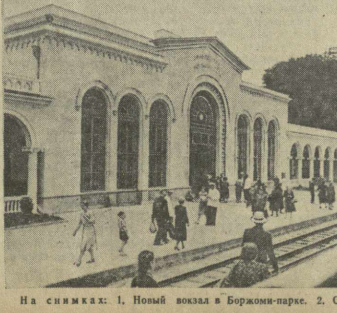
На снимках: 1. Новый вокзал в Боржоми-парке. 2. Санаторий ВЦСПС в Ликани.

Начается реконструкция стекольного завода, выпускающего тару для минеральной воды. Заканчивается строительство лестнично-балюстрады, которая свяжет курорт с Торским плато. На плато имени 26 комиссаров намечено построить новые здания, разбить парк. Плато будет связано с Боржоми фуникулером или эскалатором. Предусмотрено также строительство зданий государственного театра, Дворца культуры, музея, универмага, новых спортивных площадок. В недалеком будущем Боржоми станет еще более красивым и благоустроенным курортом.