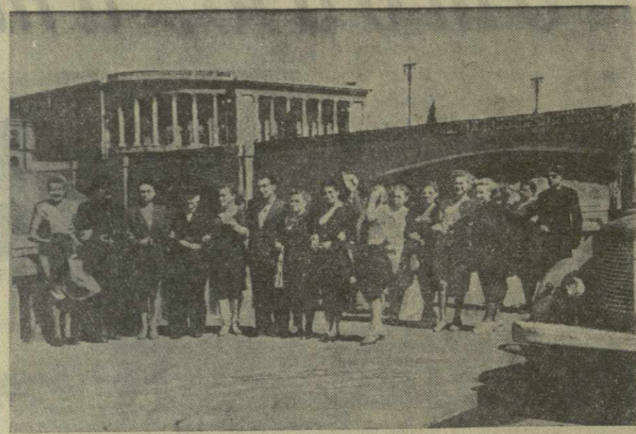
Туристский сезон в разгаре. Ежедневно в Тбилиси из различных городов и сел нашей страны приезжают туристы, совершающие во время своего отпуска увлекательные путешествия по Советскому Союзу. В Тбилиси туристы знакомятся с историческими местами города, его достопримечательностями, новостройками, посещают музеи, парки, стадионы. Гости Тбилиси встречают тбилисских гостей. К услугам приезжих — благоустроенная туристская база, обслуживаемая опытными экскурсоводами и культурными работниками. На снимке: группа туристов на набережной Кур.