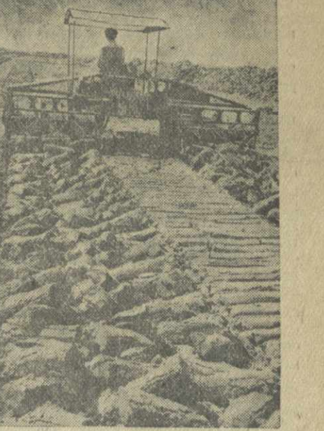
Калининская область. На торфопредприятии «Васильевский мох» вступили в строй новые машины марки «ДТУ» для укладок торфа. Каждая машина заменяет труд тридцати человек. Эти машины изготовлены на Калининском сталелитейном и машиностроительном заводе имени Первого мая. На снимке: новая марка «ДТУ» за укладкой торфа.

Полноценной жизнью в эти дни живет выросший в степи крупнейший на Волго-Доне Цимлянский порт. К его полукилометровой причальной стенке, сделанной из стальных шпунтов, подходят волжские и донские баржи, груженные лесом и углем, хлебом и различными машинами. Разгрузка их осуществляется с помощью портальных и плучных кранов. Сюда же заходят комфортабельные пассажирские дизельэлектроходы, теплоходы и пароходы, курсирующие на линиях Москва—Ростов и Ростов—Сталинград. Цимлянский гидроузел, как и все другие сооружения Волго-Дона, посещают тысячи трудящихся нашей страны. Они осматривают лесоперерабатывающую базу, куда приходят плоты с камесным лесом, шпалам, увенчанные красивыми скульптурными группами, головное сооружение Донского магистрального канала, передающее воду Цимлянского моря для орошения засушливых залесенных земель.