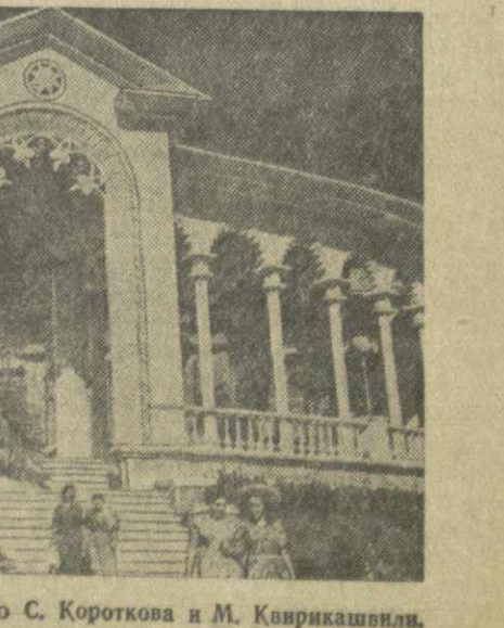
На снимках (слева направо): гагрский дом отдыха «Чай-Грузия»; на озере Рица; у входа в гагрский приморский парк.

С. ГЕГЕЧКОРИ. (Спец. корр. «Зари Востока»).