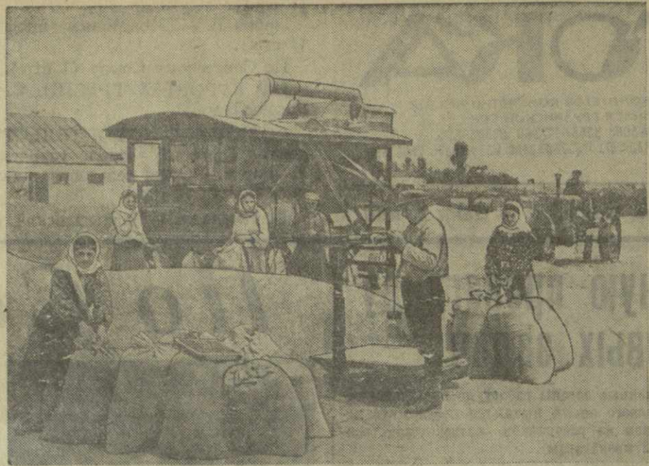
Колхоз имени Ленина Гардабанского района — один из инициаторов социалистического соревнования за высокий урожай зерновых. Убрать урожай за 20 рабочих дней и без потерь — таково обязательство колхозников передовой артели района.

В тесном сотрудничестве с механизаторами Гардабанской машинно-тракторной станции колхозные полеводы внедряют в колхозное производство машинную технику. На снимке: на колхозном токку сельхозартель имени Ленина. Механическая очистка зерна машиной «ВИМ».