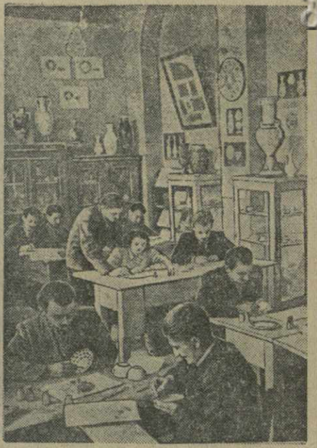
Керамическое отделение Тбилисской академии художеств готовит художников для керамических и фарфоровых предприятий страны. Многие питомцы академии работают на фабриках Украины, на Ленинградском фарфоровом заводе имени Ломоносова. Работы студентов неоднократно отмечались на выставках дипломных работ.