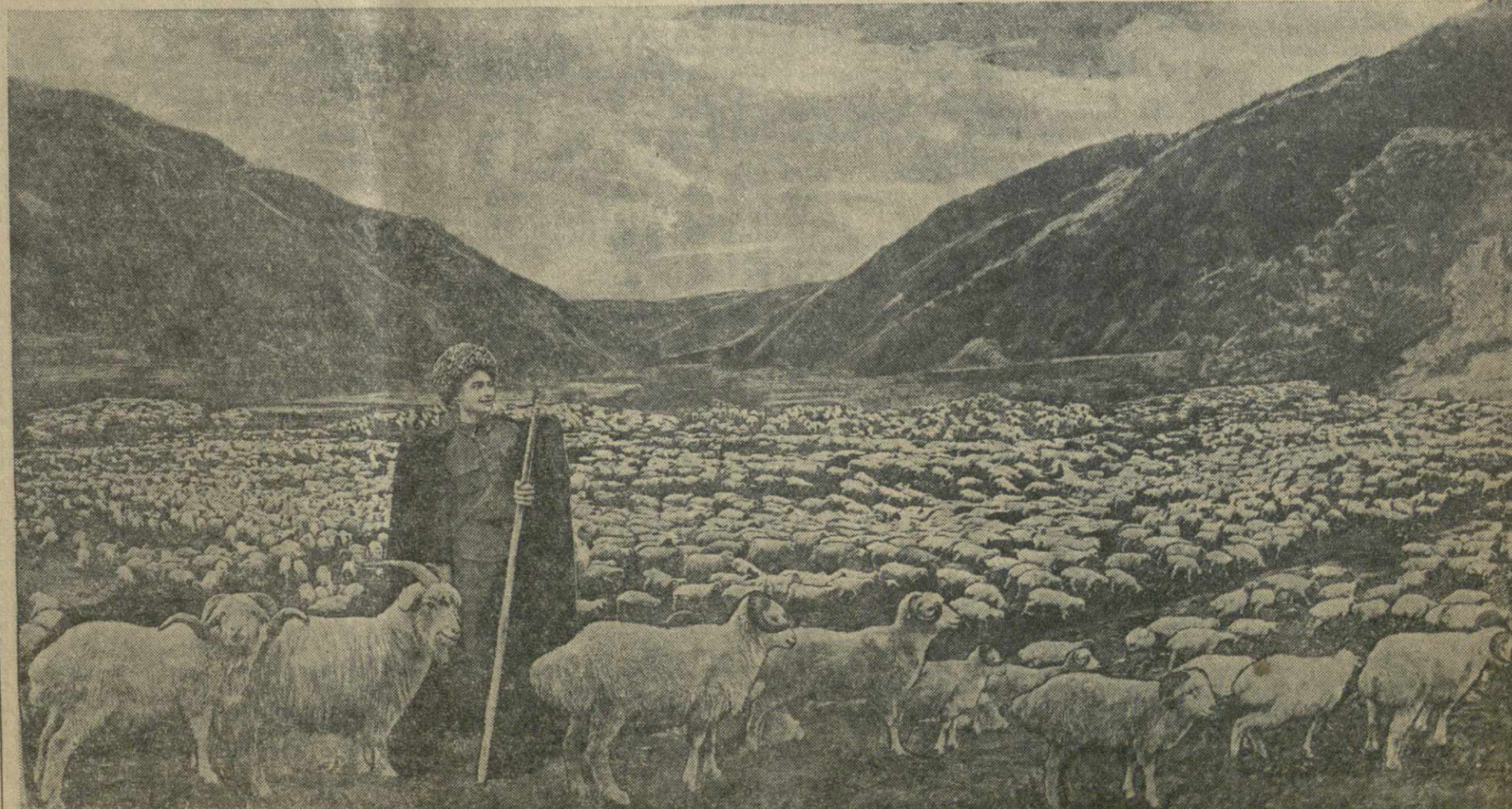
50.000 овец колхоза имени Чарквиани Душетского района вышли на зимние пастбища Северного Кавказа. На снимке: колхозные овечьи отары на Военно-Грузинской дороге.