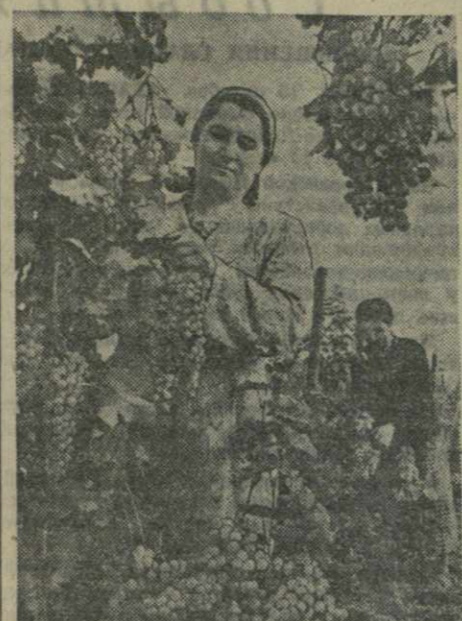
Виноградники в колхозе «Ленинск андердзи» селения Великие Гурджаанского района занимают 117 гектаров. В этом году колхозники собирают в среднем по 80 центнеров винограда с гектара при плане 52.

К 10 октября колхоз сдал на заготовительный пункт 300 тонн винограда сверх плана. Сдача продолжается.