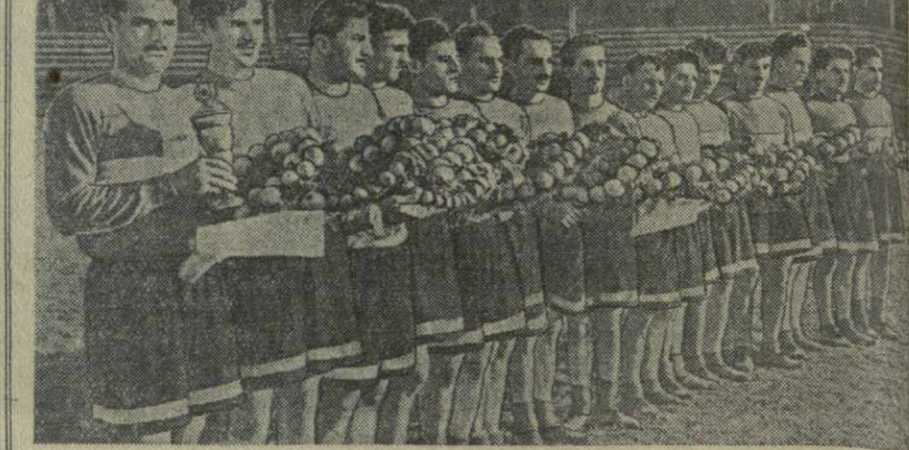
21 октября на тбилиском стадионе «Динамо» имени Л. П. Берия состоялись финальные состязания на первенство Грузии по футболу.

Первенство оспаривали команды Чохатаурского района и сельхозобластного техникума села Диди-Джихиши Самтредского района.