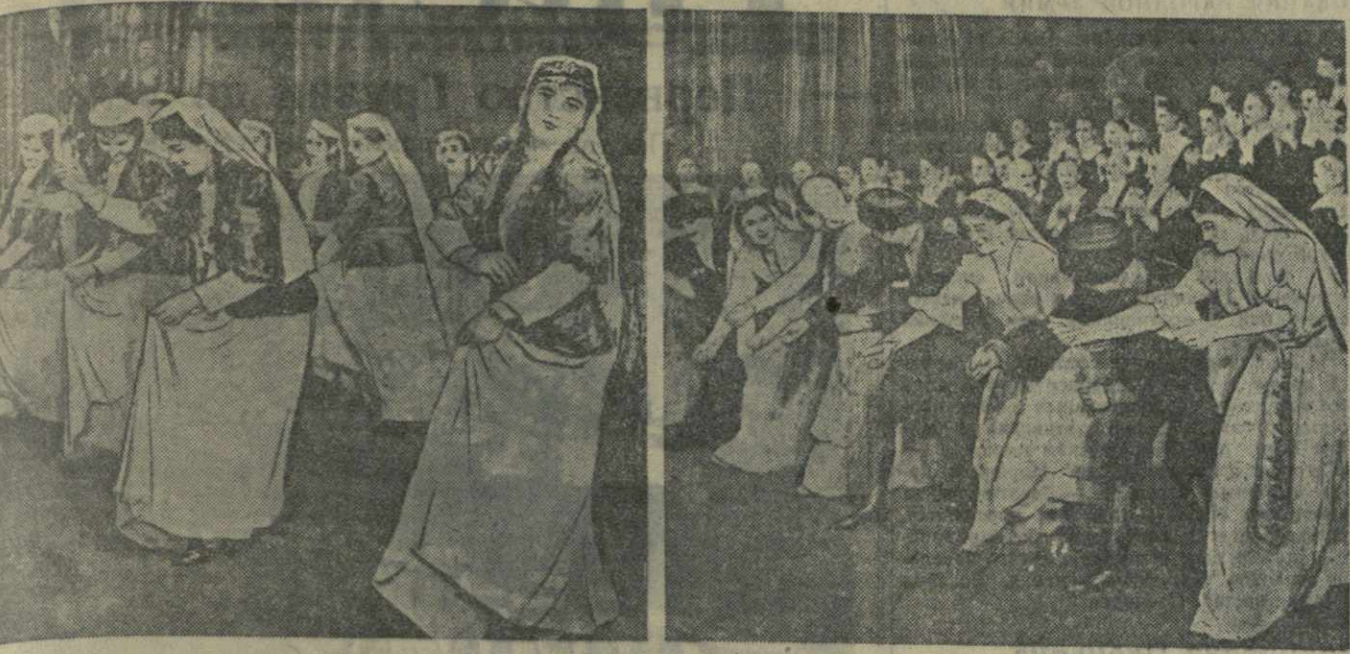
VII республиканская олимпиада художественной самодеятельности. На снимках (слева направо): выступление танцевальной группы ансамбля песни и пляски Ахалкалакского районного Дома культуры и массовый танец с песней «Урожайная» в исполнении участников ансамбля песни и пляски Дома культуры Очамчирского района.