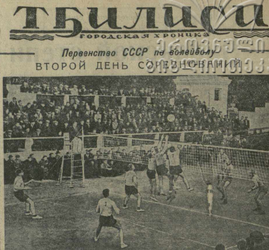
Второй день соревнований ознаменовался упорной, напряженной борьбой — в игры вступили сильнейшие команды страны. Особенно захватывающей была встреча сборной Грузии с одесским «Медиком». Проиграв первую партию, команда Грузии усилила темп игры и закончила вторую и третью партии в свою пользу. Однако волеблатель «Медика» удалось сравнять счет, а затем добиться победы с результатом 3:2. Интересно прошло состязание команд Военно-Морской медицинской академии (Ленинград) и «Спартака» (Київ). Энергично игравшие спартаковцы, сумели победить опытного противника со счетом 3:1. С таким же результатом команда Азербайджанской ССР победила сильный коллектив Ленинградского политехнического института. Чемпион СССР 1950 года ЦДСА уверенно обыграл команду Литовской ССР — 3:0. Так же легко выиграли встречу динамовцы Москвы у «Науки» (Грозный). Из остальных встреч мужских команд следует отметить победу коллектива Ленинградского Дома офицеров над свердловской командой общества «Наука» — 3:1. Интересно протекали и встречи женских команд. Вторую победу одержали волейболистки Грузии, обыгравшие команду «Спартак» (Иркутск) со счетом 3:0. Прошлогодний чемпион, команда московского «Локомотива», без труда победила коллектив Узбекской ССР. Счет — 3:0. С этим же счетом закончилась встреча московского «Динамо» с «Искрой» (Куйбышев). Победил динамовки, с результатом 3:0 выиграли также «Спартак» (Ленинград) и «Сборная Белоруссии», «Медик» (Ленинград) и команда Эстонии, «Медик» (Харьков) и волейболистки Латвии. Сегодня состоится последние состязания в предварительных подгруппах. На снимке: стадион спортивных игр в парке имени Кирова. Встреча волейболистов Риги («Даугава») и Грозного («Наука»).

«С 19 сентября, — говорится далее в письме Нам Ира, — наши командующие неоднократно предлагали быстро возобновить переговоры между делегациями обеих сторон. Для того, чтобы не откладывать больше переговоры обеих делегаций, я предлагаю, чтобы обе делегации возобновили свои встречи 25 октября в 11 часов».