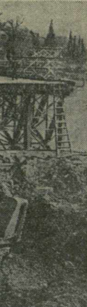
Один из старейших мостов Тбилиси — мост имени Э. Зибидзе реконструируется. На обоих берегах Куры с утра до поздней ночи трудятся бетонщики, каменщики, плотники. На строительной площадке сооружается мощный бетонный завод, работают экскаваторы. Строители уже вырыли два больших котлована для основных опор моста. На снимке: у моста имени Э. Зибидзе.

Женская команда Грузии со счетом 1:3 проиграла «Медик» (Ленинград). Из остальных встреч следует отметить победу мужской команды киевского «Спартака» над ленинградской командой Дома офицеров — 3:1, и победу женской команды ленинградского «Спартака» над своими московскими однолюбимицами.