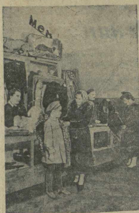
С приближением зимы оживленнее идет торговля в секции мехов Тбилисского универмага. В сентябре и октябре здесь продано почти на 800.000 рублей товаров. Внимание покупателей привлекают серебряные шкурки черных лисиц, белых, каракульские и кротовые пальто, меховые воротники и головные уборы. На снимке: продажа мехов в Тбилисском универмаге.

Вечер участников мотопробега Тбилиси-Тбилиси. В клубе имени Дзержинского состоялся вечер, посвященный итогам мотопробега Тбилиси—великие стройки коммунизма. Участники пробега рассказали о грандиозных работах, развернувшихся на великих стройках, о своих встречах со строителями, о достижениях грузинских спортсменов, преодолевших 4.700-километровый путь без единой аварии и поломки. На вечер участникам пробега были вручены грамоты Республиканского совета спортивного общества «Динамо», Тбилисского комитета по делам физкультуры и спорта и ценные подарки.