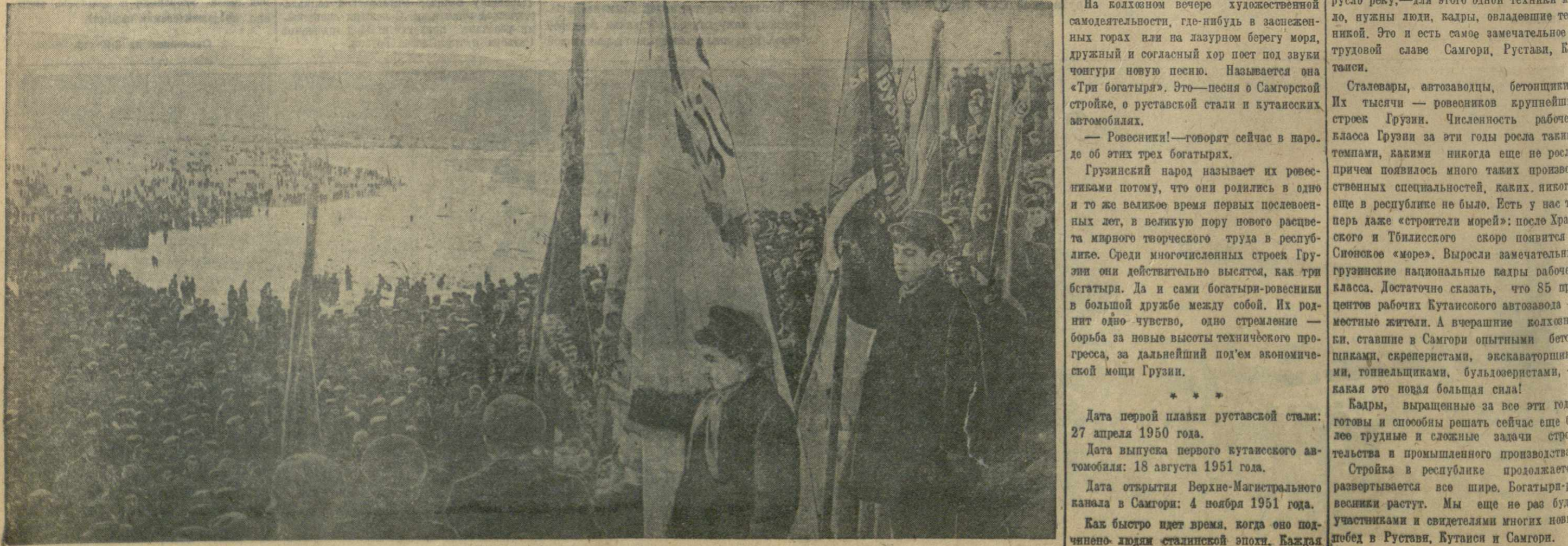
На митинге, посвященном открытию Верхне-Магистрального канала Самгорской оросительной системы.