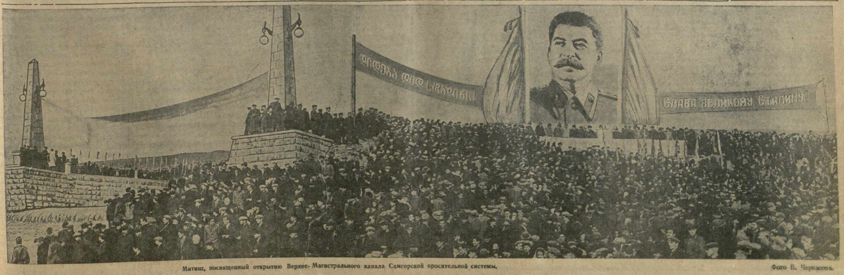
Митинг, посвященный открытию Верхне-Магистрального канала Самгорской оросительной системы.

В этот день наши взоры, наши мысли, наши чувства беспредельной любви и благодарности обращены к гениальному зодчему коммунизма — товарищу Сталину, руководству и отеческой заботе которого грузинский народ, как и все народы нашей Родины, обязан замечательным подъемом своей экономики и культуры. (Бурная, продолжительная овация).