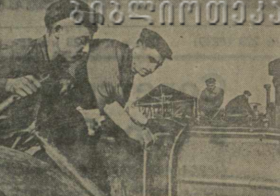
Механизаторы Телавской МТС, приступив к осеннему ремонту, обзавелись к 23 декабря, на 3 месяца раньше срока, полностью завершить ремонт 35 тракторов и 11 комбайнов 19 ноября они уже отремонтировали 8 тракторов и 3 комбайна.