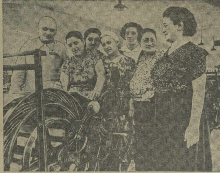
Подписка на Государственный заем развития народного хозяйства СССР (выпуск 1954 года) в подготовительном цехе Тбилисской шелкогазификационной фабрики.

Успешно проходит подписка на заем в сельхозартели имени Кагановича, имени Шевченко и других колхозах района.